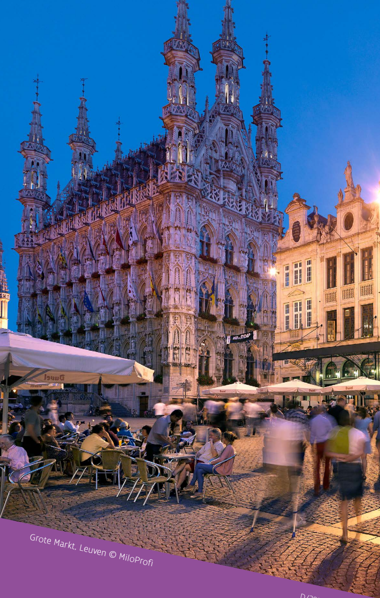
Grote Markt, Leuven