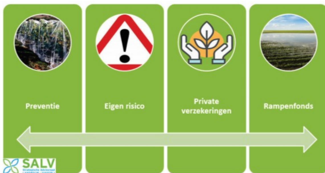
Figuur 1 Het Rampenfonds vormt een essentieel onderdeel van een evenwichtig risicobeheersinstrumentarium.