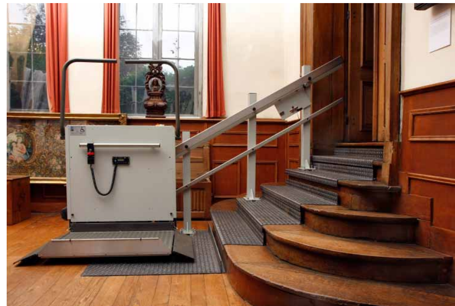
FIG. 21 Parkabdij in Heverlee

Platformliften gaan recht omhoog tot ca. 150 cm en staan al dan niet in een afgesloten koker. Zij kunnen zowel binnen als buiten geplaatst worden. Platformliften zijn enkel geschikt voor rolstoelgebruikers. Het platform telt extra voorzieningen voor de beveiliging van de rolstoelgebruiker. Platformliften worden eveneens door de gebruiker zelf gestuurd. Platformliften kunnen op een niet-destructieve, omkeerbare wijze geplaatst worden. Er bestaan ook eenvoudig verplaatsbare platformliften. Platformliften zijn er in elektrische en hydraulische uitvoeringen. De voorkeur gaat naar elektrische platformliften want lekkende hydraulische olie kan ongemerkt onherstelbare vlekken op vloeren van historische interieurs nalaten.