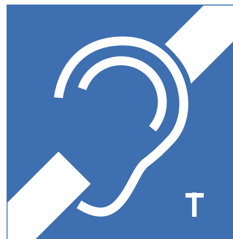
FIG. 25 Ringleidingen Ringleidingen zorgen ervoor dat mensen met een hoorapparaat met draadspoel via instelling op de T-stand, draadloos het geluid van bijvoorbeeld een kerk, een concert-, conferentie- of vergaderzaal zuiver kunnen beluisteren zonder versterking van de storende bijgeluiden.