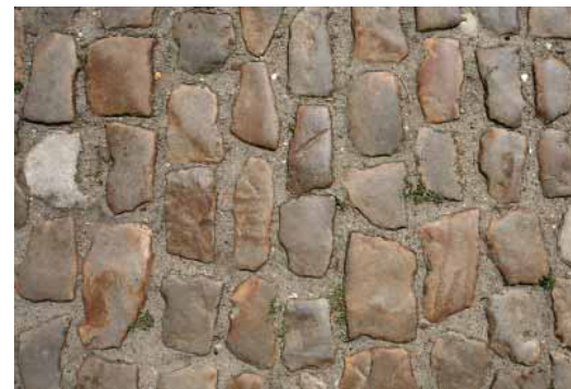
FIG. 14 Begijnhof van Diest Deze vossenkopjes zijn decennia lang stevig in rijen blijven liggen met niet te brede, goed gevulde voegen in en tussen de rijen. Daardoor liggen zij nog steeds goed vlak en zijn ze behoorlijk goed betreedbaar en berijdbaar voor mensen die moeilijk te been zijn of zich in een rolstoel verplaatsen.