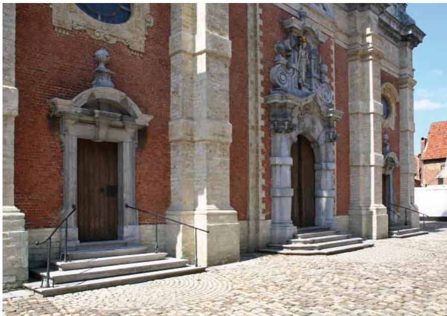
FIG. 22 Begijnhof van Lier

Trapleuningen helpen mensen die slecht te been zijn autonoom trappen te bestijgen en af te dalen. Daarom moeten er steeds leuningen aan beide kanten van de trap geplaatst worden. Deze plaatsing laat toe dat ook linkshandige mensen de trapleuningen kunnen gebruiken. De historisch smeedijzeren trapleuningen aan de begijnhofkerk beantwoorden niet helemaal aan de eisen van een integrale toegankelijkheid, maar ze zijn wel heel bruikbaar.