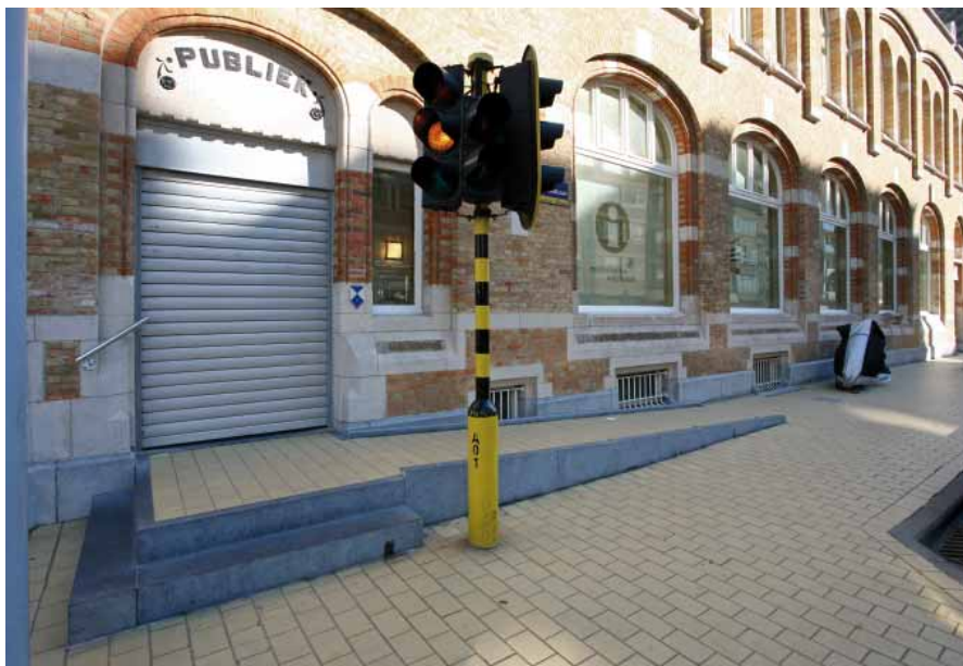
FIG. 17 Museum Kusthistorie in Middelkerke

Vaste hellingbanen zijn vanuit stabiliteitsredenen meer geschikt om grote hoogteverschillen op te vangen. Ze laten zich in de regel qua materiaal en afwerking ook goed integreren in onroerend erfgoed. Vaste hellingbanen moeten met dezelfde zorg behandeld worden als het onroerend erfgoed.