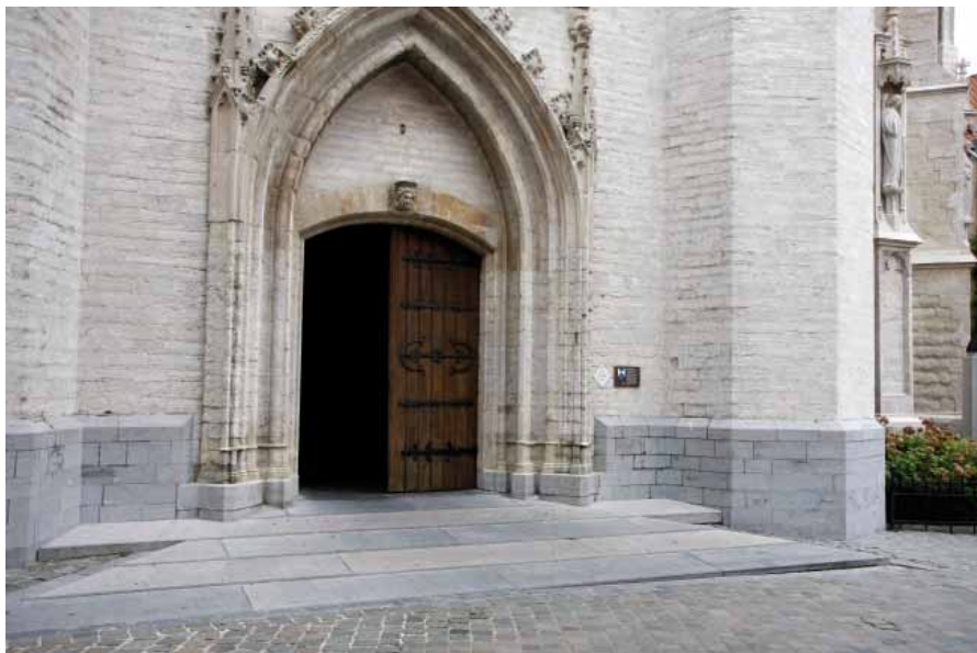
FIG. 5 Sint-Martinusbasiliek in Halle

Eenvoudige voorzieningen die inspelen op nieuwe noden betreffende toegankelijkheid - zoals trapleuningen - hoeven niet noodzakelijk in hedendaagse industrieel vervaardigde materialen zoals roestvrij staal, aluminium, glas of