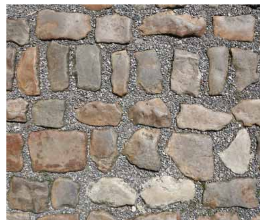
FIG. 16 Begijnhof van Diest Straatstenen die in fijn porfiergrind geplaatst worden, liggen vaster dan in straatzand. Toch moeten de voegen in en tussen rijen met kasseien in het algemeen en met kleine gepolijste vossenkopjes in het bijzonder smal zijn omdat de stenen dan stabielere liggen, niet de indruk geven in de porfiergrint te zwemmen en vooral minder hobbelig zijn, hetgeen de betreedbaarheid ten goede komt.