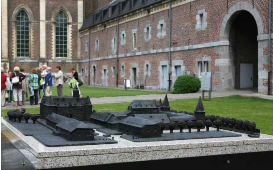
FIG. 23 Landcommanderij Alden Biesen Volumemaquettes zijn een welkom hulpmiddel om slechtziende en blinde mensen een ruimtelijk beeld te laten vormen van een object of een site.