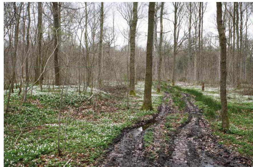
FIG. 6 Betere toegankelijkheid van beschermde landschappen is niet voor de hand liggend.

Een beschermde landschap is een landschap dat volgens dit decreet definitief beschermd is.