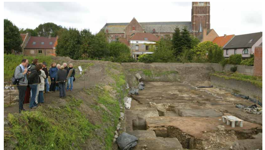
FIG. 4 Noodopgraving in Oudenburg

Om de leesbaarheid van de handleiding te bevorderen zijn tekst en ondertekeningen in een groter lettertype dan de voorgaande handleidingen afgedrukt. Op de website van het VIOE kan de handleiding in pdf naar behoeven verder uitvergroot worden.