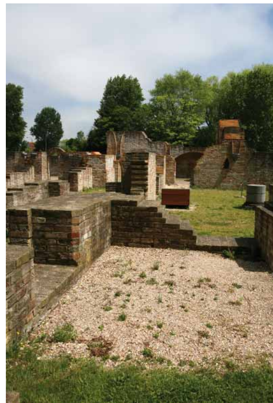
FIG. 10 Abdij Ten Duinen in Koksijde

Toegankelijkheid van bovengrondse, permanent opengestelde archeologische sites zoals de abdij Ten Duinen in Koksijde of de burchtrüine van Lanaken is te vergelijken met deze van permanent opengestelde gebouwen met erfgoedwaarde of beschermde parken en tuinen.