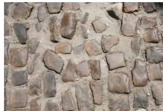
FIG. 15 Begijnhof van Diest Straatstenen worden na wegenwerken dikwijls onoordeelkundig en slordig herplaatst zonder de rijen en voegbreedte te respecteren. De vossenkopjes worden zo moeilijk betreedbaar en los gewrikt door wagens en te zwaar verkeer, waardoor ze gaan wankelen en worden uitgereden.