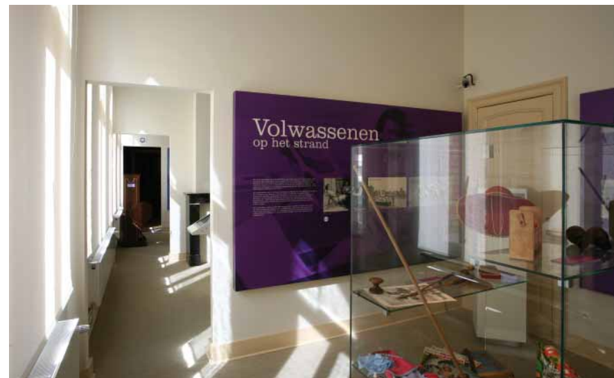
FIG. 7 Museum Kusthistories in Middelkerke Het Museum Kusthistories is gevestigd in het beschermde voormalige Postgebouw van Middelkerke. De nieuwe muuropeningen bevorderen de circulatiemogelijkheden en daardoor de ontsluiting en de toegankelijkheid voor alle gebruikers.

Het is bij vergunningsplichtige werken aan publiek toegankelijke onroerend erfgoed ten zeerste aangewezen om het agentschap Ruimte en Erfgoed vanaf het begin bij het dossier van vergunningsplichtige werken aan beschermd erfgoed te betrekken. Het agentschap moet immers conform artikel 35 van het Besluit van de Vlaamse Regering van 5 juni 2009 tot vaststelling van een gewestelijke stedenbouwkundige verordening betreffende toegankelijkheid, in zijn adviezen de afweging maken betreffende de vereisten van toegankelijkheid en het behoud van de erfgoedwaarden.