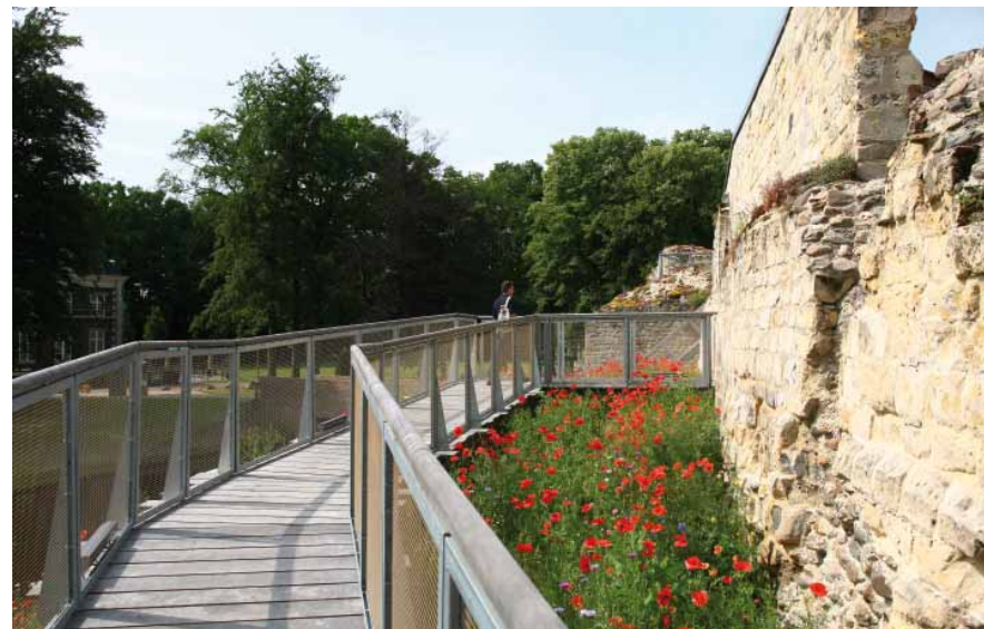
FIG. 2 Waterburcht Pietersheim in Lanaken

Deze brochure gaat ervan uit dat elke gebruiker zoveel mogelijk zelfstandig en samen met anderen zo goed mogelijk moet kunnen genieten van ons permanent opengesteld onroerend erfgoed. Iedere gebruiker en bezoeker zou op haar/zijn manier aan activiteiten die er plaatsvinden, moeten kunnen deelnemen, maar steeds rekening houdend met de 'draagkracht' en het behoud van de intrinsieke waarden van het betrokken erfgoed.