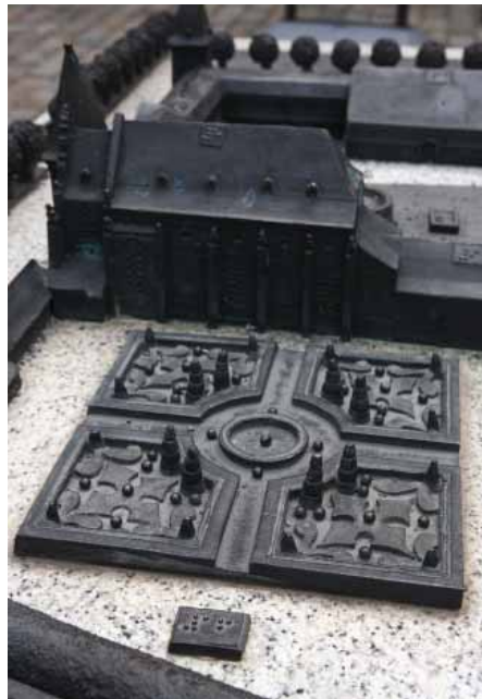
FIG. 24 Landcommanderij Alden Biesen Brailleschrift geeft uitleg over de onderdelen van de volumemaquette van de site. Braille is voor blindgeborenen het geschreven communicatiemiddel bij uitstek, maar de grote groep van laatblinden en slechtzienden zijn er niet mee gebaat omdat zij het op latere leeftijd niet meer aanleren. Interactieve audio-ondersteuning, waarbij het betaste object becommentarieerd wordt, biedt hier een oplossing. Dat is de idee achter de erfgoedconsole (hoofdstuk 7).

De groep van bezoekers en gebruikers die blind zijn bestaat uit personen die, na de beste optische correctie met bril of lenzen, een gezichtsscherpte hebben van minder dan 1/10 met beide ogen. Dat wil zeggen dat deze mensen slechts op 1 meter afstand waarnemen wat anderen op 10 meter zien. Blind is men ook wanneer het gezichtsveld ten hoogste 20 graden bedraagt. Bij goed ziende personen is het gezichtsveld ongeveer 180 graden.