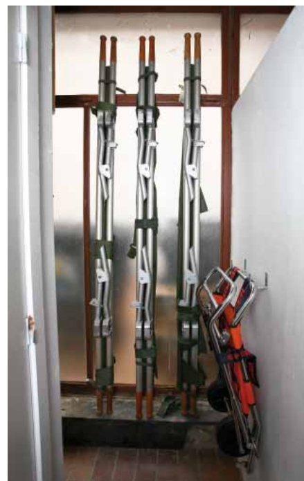
FIG. 26 Kunstencentrum Vooruit in Gent

Uit onderzoek blijkt dat juist oudere slechthorenden meer moeite hebben met het gebruik van ondertiteling omdat zij minder informatie tegelijk kunnen verwerken. Automatische spraakherkenning staat nog in de kinderschoenen, maar er zit toekomst in. Naar mate automatische spraakherkenners sneller en nauwkeuriger werken en de gebruikers meer vertrouwd met het systeem zullen zijn, zal het comfort toenemen.