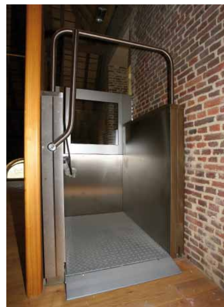
FIG. 8 Abdij Herkenrode De zolders van het hoevecomplex van de abdij zijn door middel van kooiliften ontsloten en toegankelijk gemaakt. Om de vloerniveaus van de zolders via het hoger vloerniveau van de centraalbouw met elkaar te verbinden moesten bijkomende trappen voorzien worden. Om de zolders ook voor rolstoelgebruikers met elkaar te verbinden, heeft de restauratie-architect platformliften voorzien. De platformliften en trappen zitten verscholen achter een gesloten houten wand die meteen ook dienst doet als borstwering voor het trapbordes.