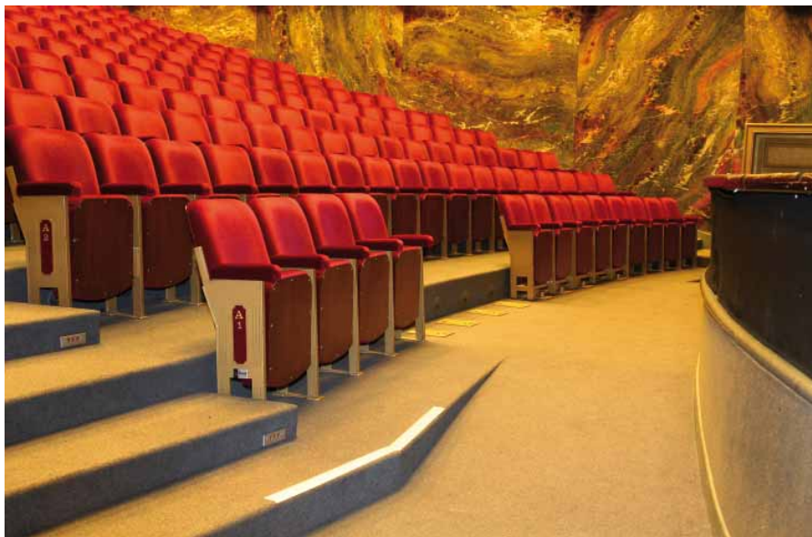
FIG. 12 Kunstencentrum Vooruit in Gent

De Theaterzaal is op twee niveaus toegankelijk gemaakt voor rolstoelgebruikers. De toegankelijkheid is verzekerd door een discrete hellingbaan en negen tijdelijk wegneembare zetels.