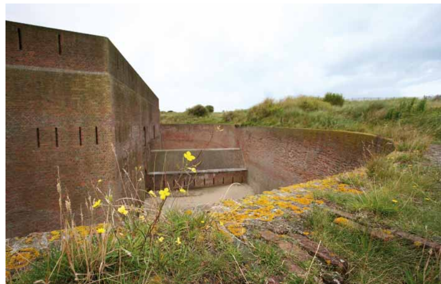
FIG. 27 Fort Napoleon in Oostende

Ook de trajecten van het gemeenschappelijke en toegankelijke vervoer kunnen aangekondigd worden op de website van Toegankelijk Vlaanderen.