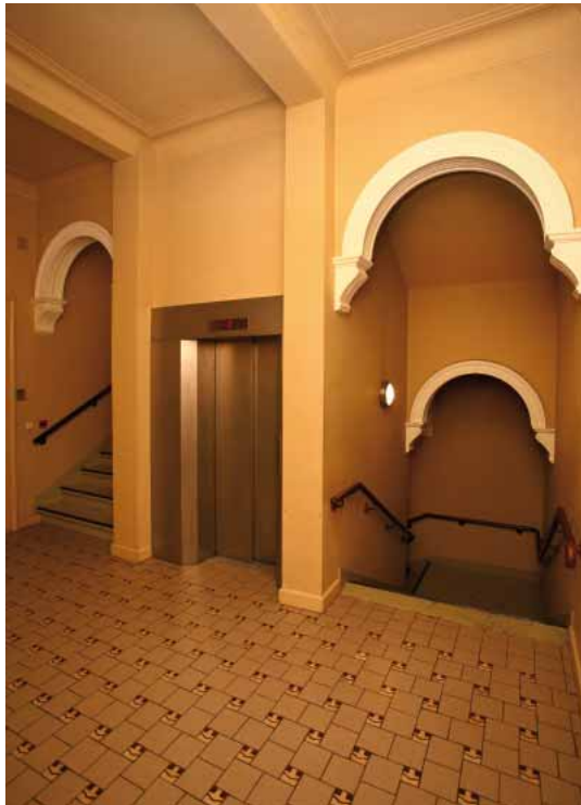
FIG. 19 Kunstencentrum Vooruit in Gent De kooilift is ingebouwd in de centrale traphal en bedient tot en met de derde verdieping. (© VIOE, foto Kris Vandevorst)

Wegneembare hellingbanen lenen zich uitstekend voor het overbruggen van kleine hoogteverschillen waar vaste hellingbanen om erfgoedredenen niet aangewezen zijn.