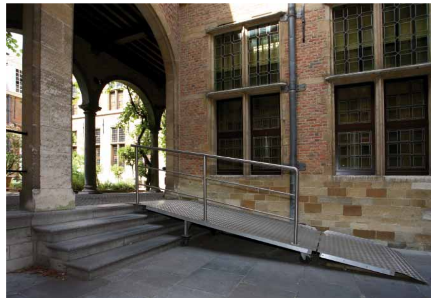
FIG. 18 Museum Rockoxhuis in Antwerpen

Toch kan het om kunsthistorische redenen aangewezen zijn om bijgevels met hoge architecturale waarde - waar imposante trappenpartijen en plinten onverbreekbaar deel uitmaken van het architecturale concept - wegneembare hellingbanen