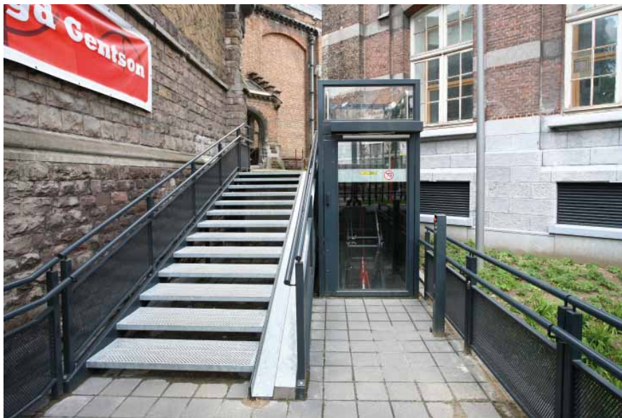
FIG. 20 Leopoldkazerne in Gent

In de kazerne heeft plaatsgebrek voor een hellingbaan geleid tot de constructie van een platformlift die het aanzienlijk hoogteverschil tussen de twee niveaus overbrugt.