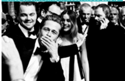
ONCE UPON A TIME IN HOLLYWOOD (20/1)