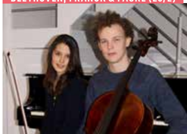
BEETHOVEN, FRANCK & FAURÉ (20/2)