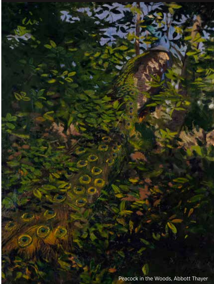
Peacock in the Woods, Abbott Thayer