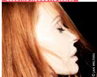
ELECTRO ACOUSTIC (22/2)