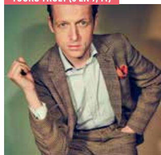
YOURS TRULY (8 EN 9/11)