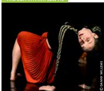
THE SEA WITHIN (23/11)