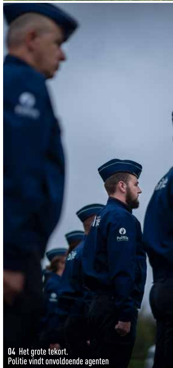
04 Het grote tekort. Politie vindt onvoldoende agenten

VERDELING RandKrant november wordt bus-aan-bus verdeeld in Grimbergen, Vilvoorde, Machelen, Zaventem, Kraainem, Wezembeek-Oppem, Tervuren, Overijse en Hoeilaart.