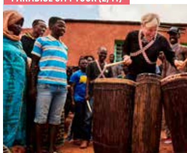
PARADISE CITY TOUR (2/11)