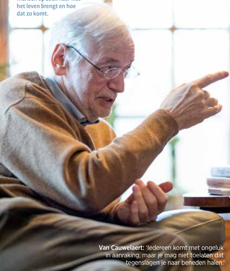
Van Cauwelaert: 'Iedereen komt met ongeluk in aanraking, maar je mag niet toelaten dat tegenslagen je naar beneden halen.'

In onze reeks Levenskunst gaan we met een aantal mensen op zoek naar wat het leven brengt en hoe dat zo komt.