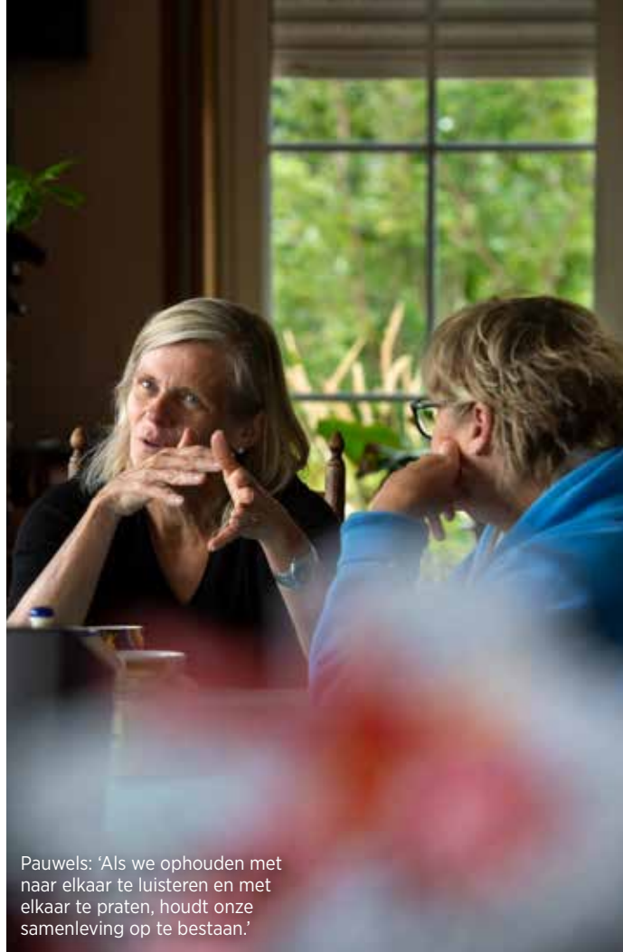
Pauwels: 'Als we ophouden met naar elkaar te luisteren en met elkaar te praten, houdt onze samenleving op te bestaan.'

▶ studenten een einde aan zijn leven gemaakt. Op zo'n momenten ben je sprakeloos. Je wil troost brengen, maar voelt je tegelijkertijd machteloos. Woorden schieten dan te kort. Het heeft me getriggerd om iets te doen rond medeleven. Ik speelde al een tijd met de idee om een plek rond 'medeleven' op onze campus te creëren. De tragische gebeurtenis heeft het proces versneld. We hebben besloten dat er een beeld van kunstenaar Philip Aguirre komt. Het is een moderne versie van een piëta die we een bijzondere plaats op onze campus zullen geven, ergens in het groen.'