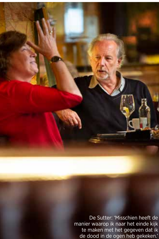
De Sutter: 'Misschien heeft de manier waarop ik naar het einde kijk te maken met het gegeven dat ik de dood in de ogen heb gekeken.'