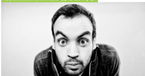
DE SCHAAMTE VOORBIJ (1/12 EN 31/1)