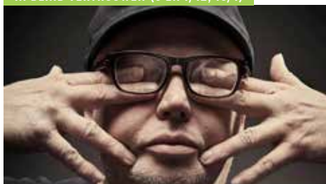
IN BLIND VERTROUWEN (5 EN 7/12, 19/1)