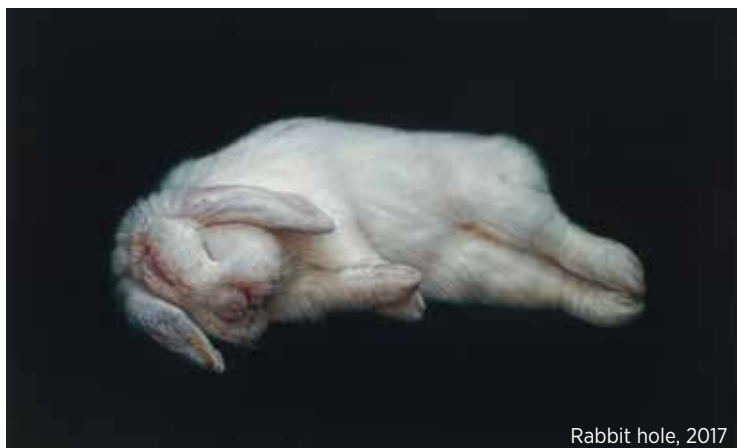
Rabbit hole, 2017