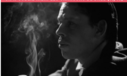
ON N'OUBLIE RIEN: LES CHANSONS DE BREL (13/10)