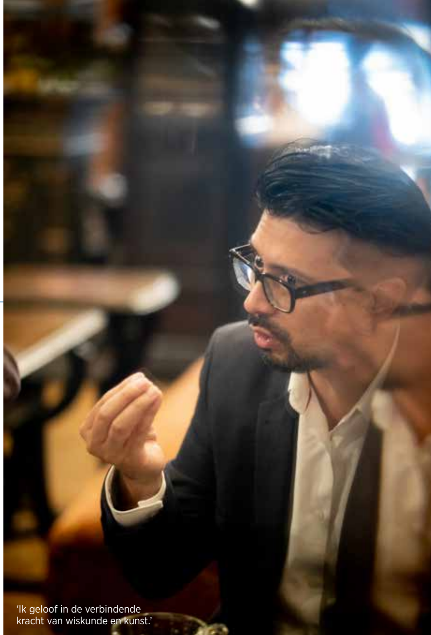
'Ik geloof in de verbindende kracht van wiskunde en kunst.'

Meersman: 'Dat is een interessant standpunt dat me aan het denken zet. Voor mij bestaat dé waarheid niet. Zelf pleit ik er heel erg voor om met elkaar in debat te gaan en goede argumenten aan te reiken zodat we elkaars waarheid beter kunnen begrijpen. Dat wiskunde en wetenschap ons van andere diersoorten onderscheiden en ons inzichten