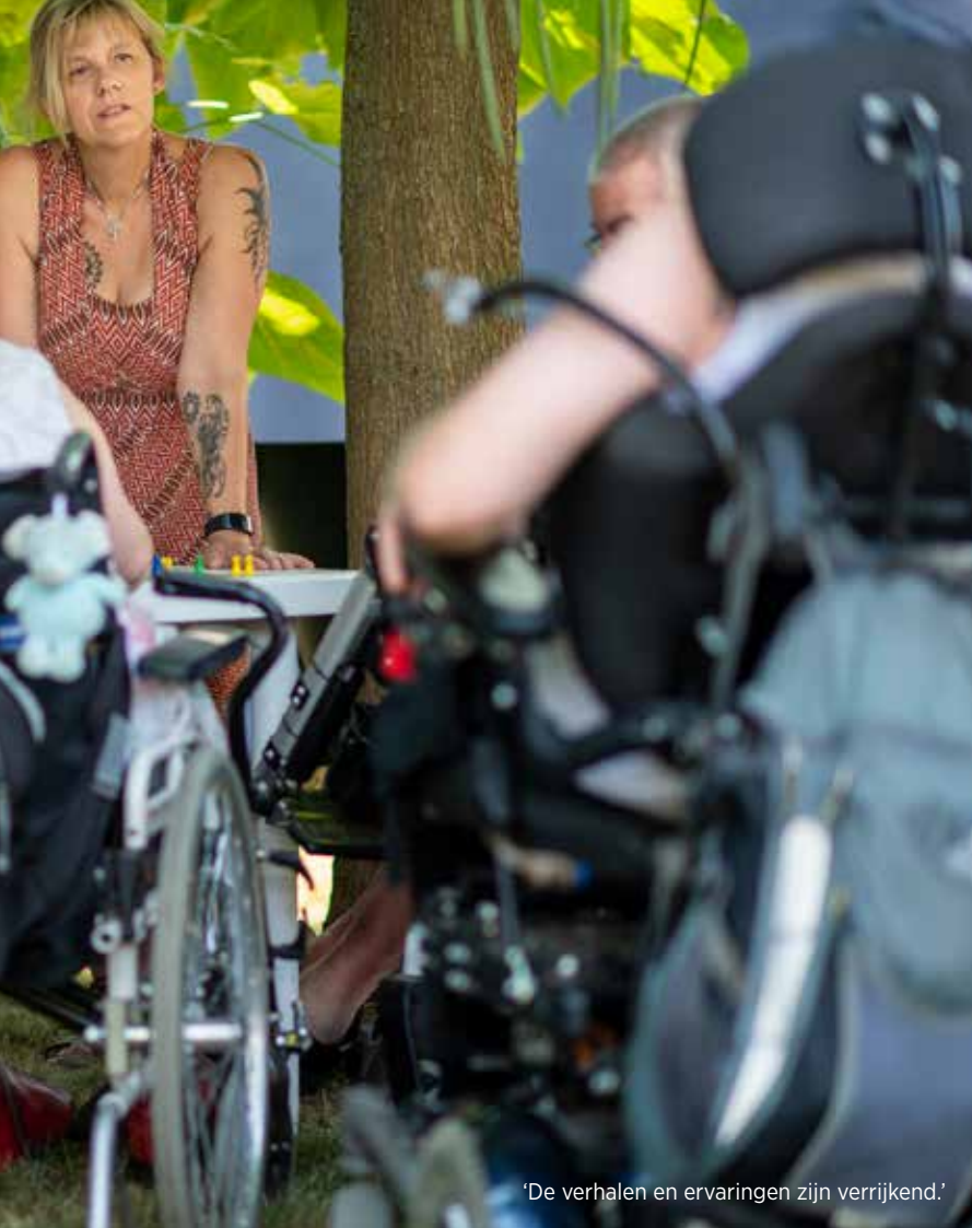
'De verhalen en ervaringen zijn verrijkend.'

mensen willen helpen. Misschien is dat niet iedereen gegeven, maar mij ligt het. Door mijn vrijwilligerswerk is mijn bewondering voor het personeel in de zorgsector toegenomen. Het is zagezegd de 'zachte sector', maar die mensen zetten zich met hart en ziel in. Wat zij met beperkte middelen doen, is fenomenaal.'