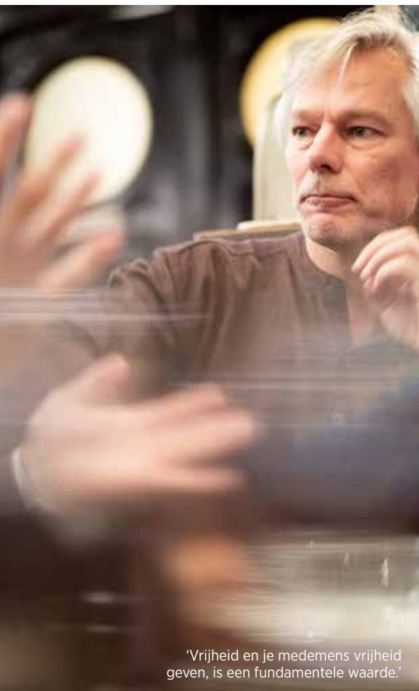
'Vrijheid en je medemens vrijheid geven, is een fundamentele waarde.'

Meersman: 'Ik zou het woord 'evolutie' naar voor willen schuiven. Daarmee bedoel ik 'als mens in een snel veranderende wereld evoluteren'. Zoiets als een persoonlijke renaissance. Voor mij betekent het jezelf opnieuw durven uitvinden en andere wegen durven inslaan. Het lijkt me een heilzame manier om verzuring of een burn-out voor te zijn.'