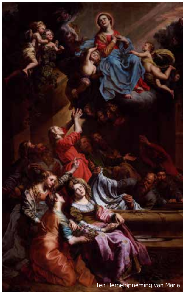
Ten Hemelopneming van Maria

Wat opvalt bij de werken van Theodoor Van Loon zijn de kleurenpracht en het spel tussen licht en schaduw. Ook de gesofisticeerde details die je in zijn texturen en ornamenten terugvindt, zijn zeer kenmerkend voor zijn