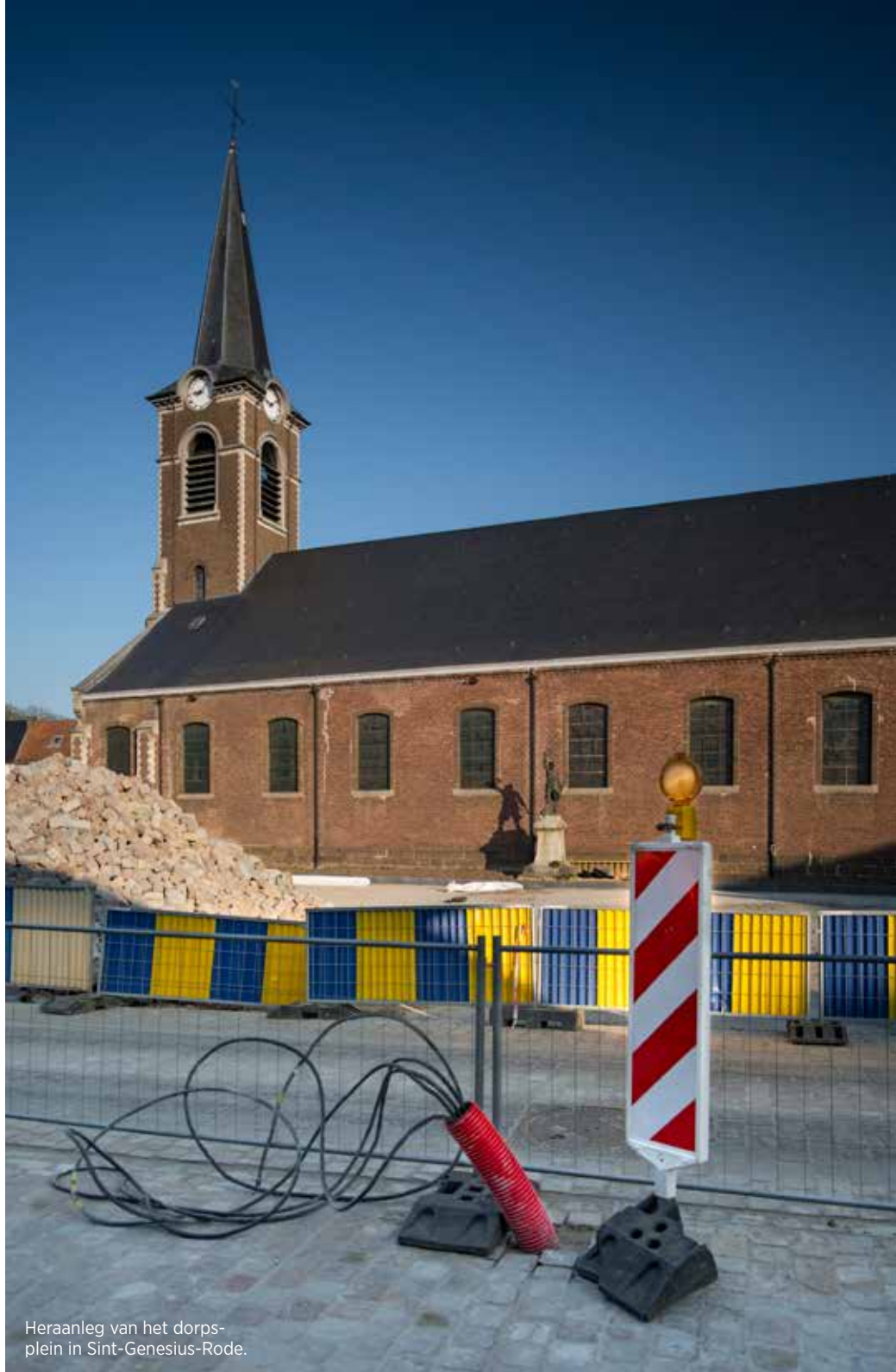
Heraanleg van het dorpsplein in Sint-Genesius-Rode.

Volgens het masterplan, dat gerealiseerd wordt tussen 2016 en 2020, worden een aantal straten in verschillende fases heraanlegd. Daarnaast is de uitbreiding van de gemeentelijke basisschool 't Villegastje en een nieuw administratief gebouw voor het OCMW, de bibliotheek en het Huis van het