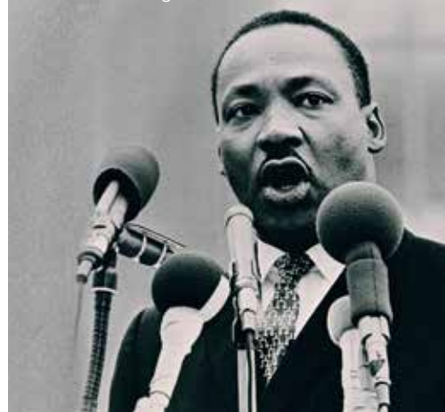
Martin Luther King

Deelnemers krijgen de opdracht om de toehoorders te overtuigen deel te nemen aan een revolutie. Wil je deelnemen of graag als publiek de deelnemers in actie zien? Zorg dan dat je er op donderdag 19 april bij bent in het Beurscafé in Brussel. • ND