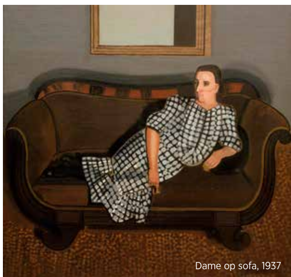
Dame op sofa, 1937