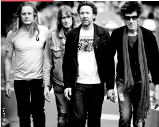
THE SCABS (26/5)