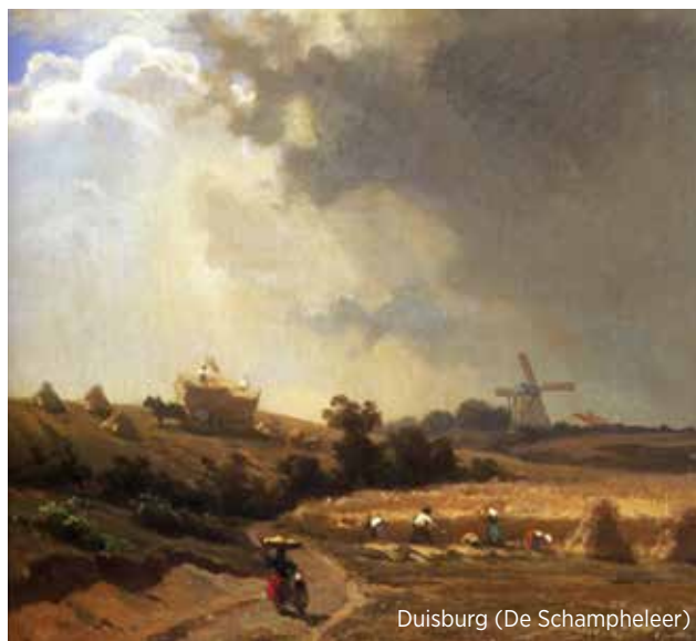
Duisburg (De Schampheleer)

sommige kunstwerken meer dan duidelijk. Het beeld van een vrouw bij de bakoven of arbeiders die hooi op het platteland oogsten, ze zijn de stille getuigen van een verleden dat niet zo erg lang achter ons ligt. Ook de hedendaagse werken nodigen je uit om stil te staan bij de omgeving die ons als mens omringt en de schoonheid ervan te ervaren. Furament 2017 loopt van 28 april tot 18 juni. Elke vrijdag, zaterdag en zondag kan je vijf types tentoonstellingen gratis bezoeken. Een gevarieerd aanbod van schilderijen van oude en nieuwe meesters, kleine beeldhouwwerken, foto's en kinderte-