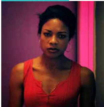
MOONLIGHT (3/5, 9/5 & 28/5)