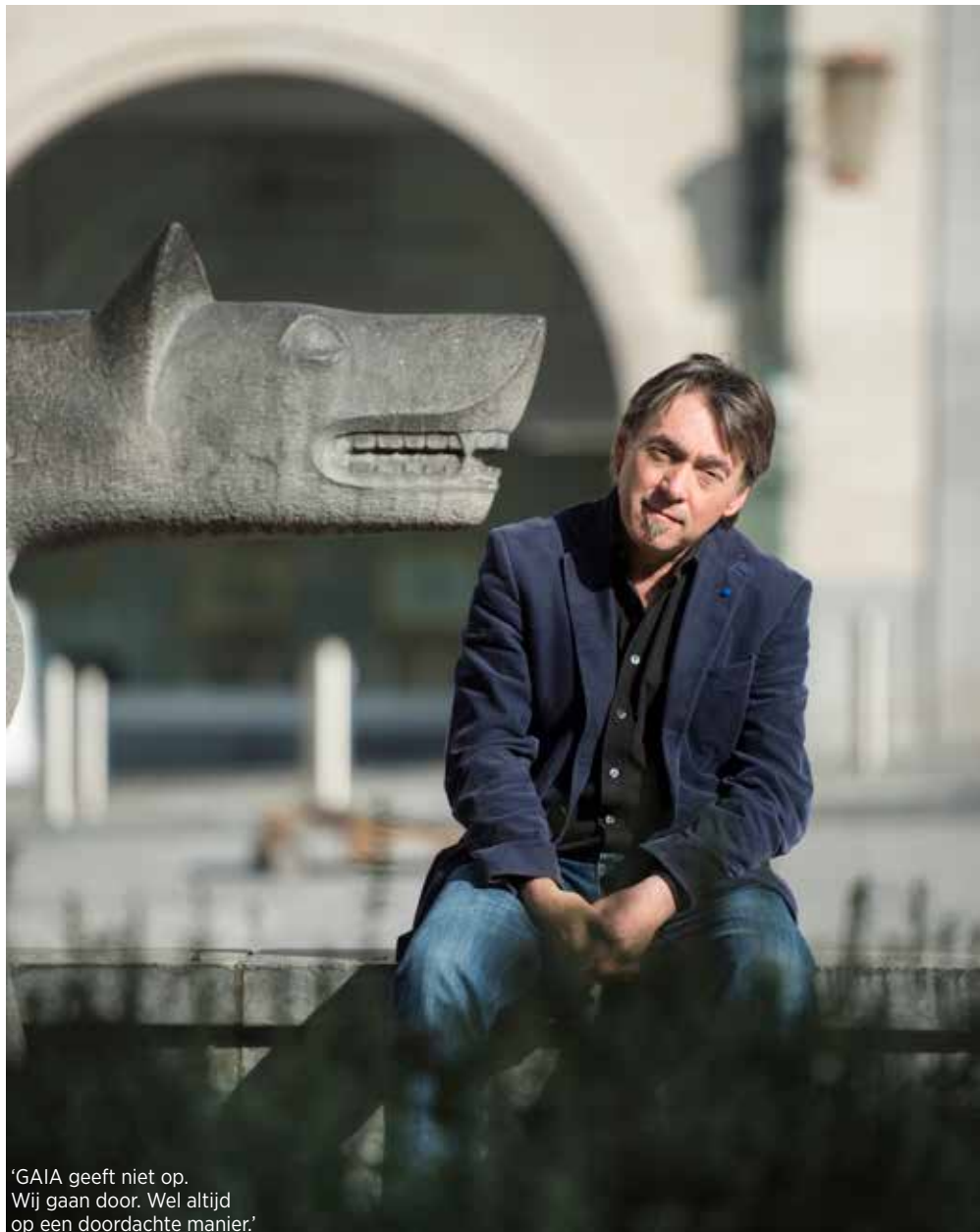
'GAIA geeft niet op. Wij gaan door. Wel altijd op een doordachte manier.'

Ook de vastberadenheid waarmee hij altijd zijn idealen heeft gevolgd, zit hem in de genen, zegt hij. 'Mijn familie is nooit uit Beersel weg geweest. De enige uitzondering was mijn grootmoeder. Toen zij jong was, trok haar vader een tijd over de grens naar Frankrijk, om een paar centiemeren meer te verdienen. Omdat mijn grootmoeder geen Frans kende, werd ze gepest. Erg lang heeft dat niet geduurd, want la petite Flamande verweerde zich, als het moest zelfs letterlijk met slaande argumenten', lacht hij. 'Ook later was ze een vrouw waar je bij wijze van spreken een atoombom op kon gooien, nog krabbelde ze recht en ging ze door. Mijn hele familie bestond uit harde werkers, die rechtvaardigheid hoog in het vaandel droegen, maar die tegelijk het leven graag vierden en een en ander konden relativeren. Het is die mix die ook mij gemaakt heeft tot wie ik ben.'