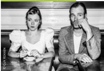
JAWOORD (15/12, 26/1, 28/1)

Max Last Dilbeek, CC Westrand, 02 466 20 30