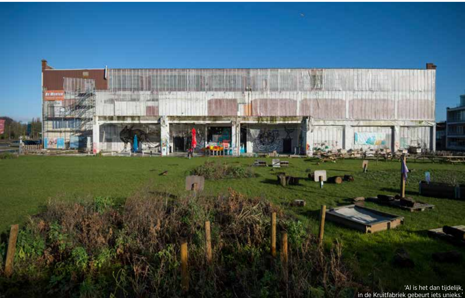
'Al is het dan tijdelijk, in de Kruitfabriek gebeurt iets unieks.'

Voor de buiteninrichting kreeg Cornut de vrije hand om er iets origineels van te maken. Met ondersteuning van de Vlaamse Landmaatschappij (VLM) koos ze voor een groenzone waar omwonenden mee groenten komen kweken in twintig houten bakken, volgens het principe van Urban Farming. Het geheel is uitgebouwd met speel- en wandelzones, met de uitbeelding van voorwerpen die verband houden met de activiteiten van de burens en met een leuke heuvelpartij vanwaar je de site kunt overzien. Bloemenweiden en een insectenhotel ontbreken niet.