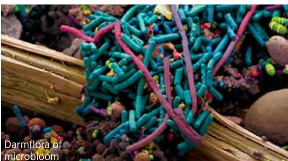
Darmflora of microbiom