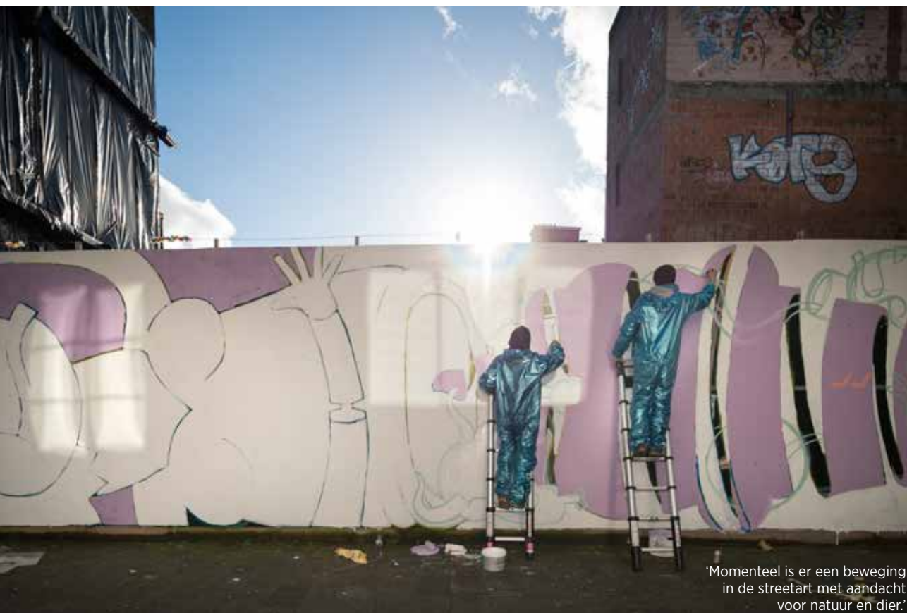
'Momenteel is er een beweging in de streetart met aandacht voor natuur en dier.'