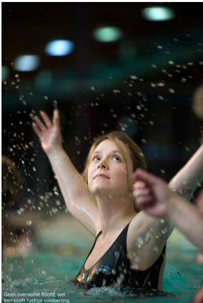
Geen oververhit hoofd, wel een soort rustige voldoening.

TEKST Ines Minten • FOTO Filip Claessens