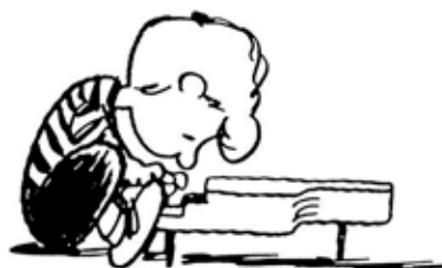
SNOOPY & PEANUTS (20/3)