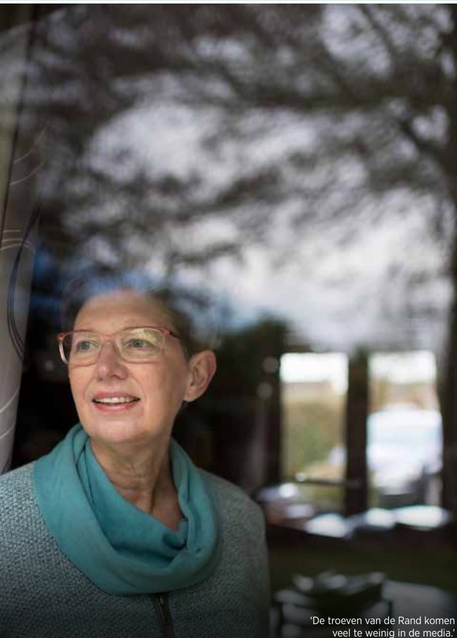
'De troeven van de Rand komen veel te weinig in de media.'

gewestplannen te toetsen aan de economische vijfjarenplannen. Er ging toen veel aandacht naar de zuidelijke Rand. De oorspronkelijke bevolking raakte er nog moeilijk aan bouwgronden omdat de eurocraten de prijzen de hoogte injoegen. Daar heb ik toen onderzoek naar gedaan. Ik trok naar de gemeentehuizen en spitte er zolders en kelders uit op zoek naar bouwvergunningen en niet-vervallen verkavelingsvergunningen.