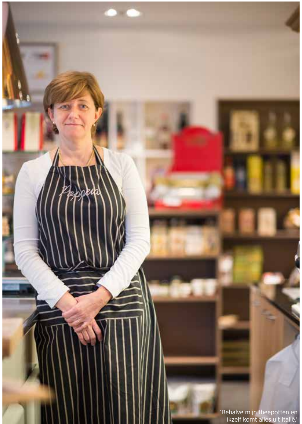
'Behalve mijn theepotten en ikzelf komt alles uit Italië.'

Ze heeft keihard gewerkt voor Electrabel, legt ze uit. Werkdagen van 14 tot 16 uur waren eerder regel dan uitzondering. Een rustiger bestaan heeft ze met de carrièreswitch nooit nagestreefd. 'Ik besepte maar al te goed dat een eigen zaak geen peulschil is. Ik heb nu een heel nieuwe wereld leren kennen en ik doe het elke dag met bijzonder veel passie, maar ik heb ontzettend veel respect gekregen voor jonge ondernemers. Je staat van 's morgens tot 's avonds op je benen in je zaak. Voor en na sluitingstijd zijn er bestellingen en facturen, je zaak moet netjes zijn, je gerechten moeten klaargemaakt worden. Je bent eigenlijk alleen nog met je zaak bezig. Ik ben eraan begonnen met 30 jaar werkervaring en ik kende alle instanties waar ik terecht moest voor vergunningen en dergelijke. Ook financieel startte ik niet van nul, zoals veel twintigers die het aandurven om iets op te starten. Echt waar: fysiek en administratief is het een zwaarder bestaan dan in een grote onderneming werken. Nu, ook over dit soort zaken mag je vooraf niet te veel nadenken. Als je te veel stilstaat bij details, doe je niks in het leven. Het is zoals met kinderen krijgen: je wil het en je gaat ervoor. En dat doe je ook maar beter zonder alles te weten wat je nog te wachten staan', lacht ze. 'Nee, ik was gelukkig bij Electrabel en ik ben het nu evenzeer: niet meer, niet minder. Ik ben gelukkig van nature.'