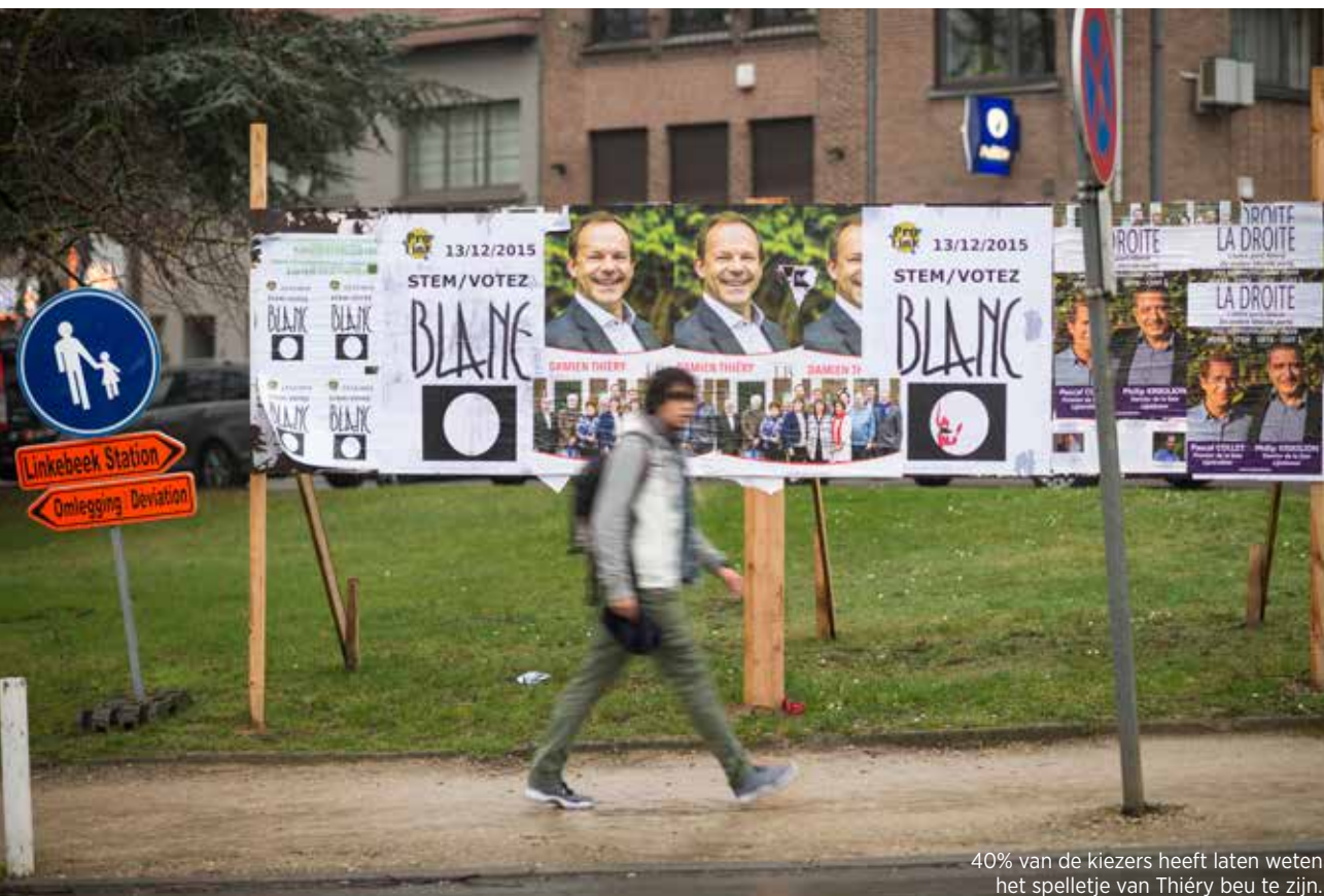
40% van de kiezers heeft laten weten het spelletje van Thiéry beu te zijn.