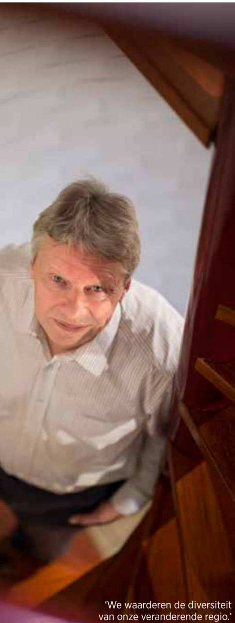
'We waarderen de diversiteit van onze veranderende regio.'

nog slechts negen keer per jaar en wordt telkens maar in de helft van de regio in alle brievenbussen verspreid. Dat is heel ingrijpend. Het heeft de uitstraling van onze hele organisatie gekortwiekt. We betreuren dat het op die manier moest gebeuren.'