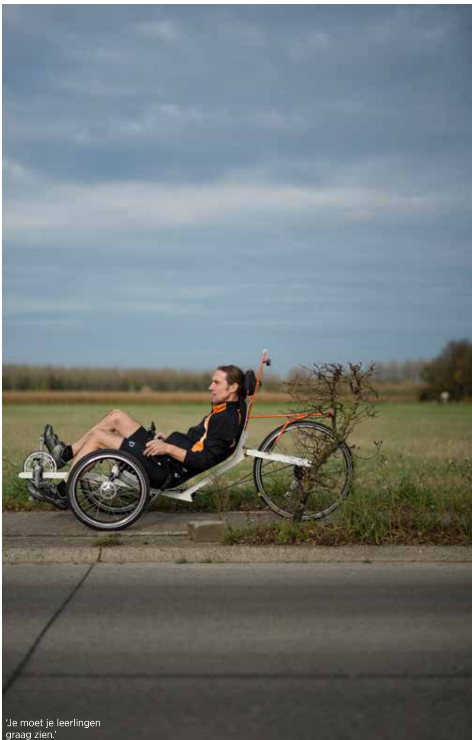
'Je moet je leerlingen graag zien.'

People cycling along the Leuven-Brussels high-speed train line sometimes see him. A thin, grey-pigtailed man on a racing bike, a retro bike or a self-constructed, open reclining bicycle. From Herent to the Royal Athenaeum School in Zaventem and back, peddling furiously to cover 50 km a day. Dutch teacher, bike builder and artist. Has a lot changed in the classroom over the last 20 years? 'The language! Twenty years ago, 90% of the students in my class were Dutch-speakers, whereas 80% of them are now from other countries. Some students can speak good Dutch within a short space of time, while others manage to communicate but fail when it comes to the language of the course. I have to adapt and give more thought to how I present things. When I used to say the truth is a lie it used to raise a smile. Because the sentence does have something in it but they are becoming less and less able to recognise the paradoxical side of this.'