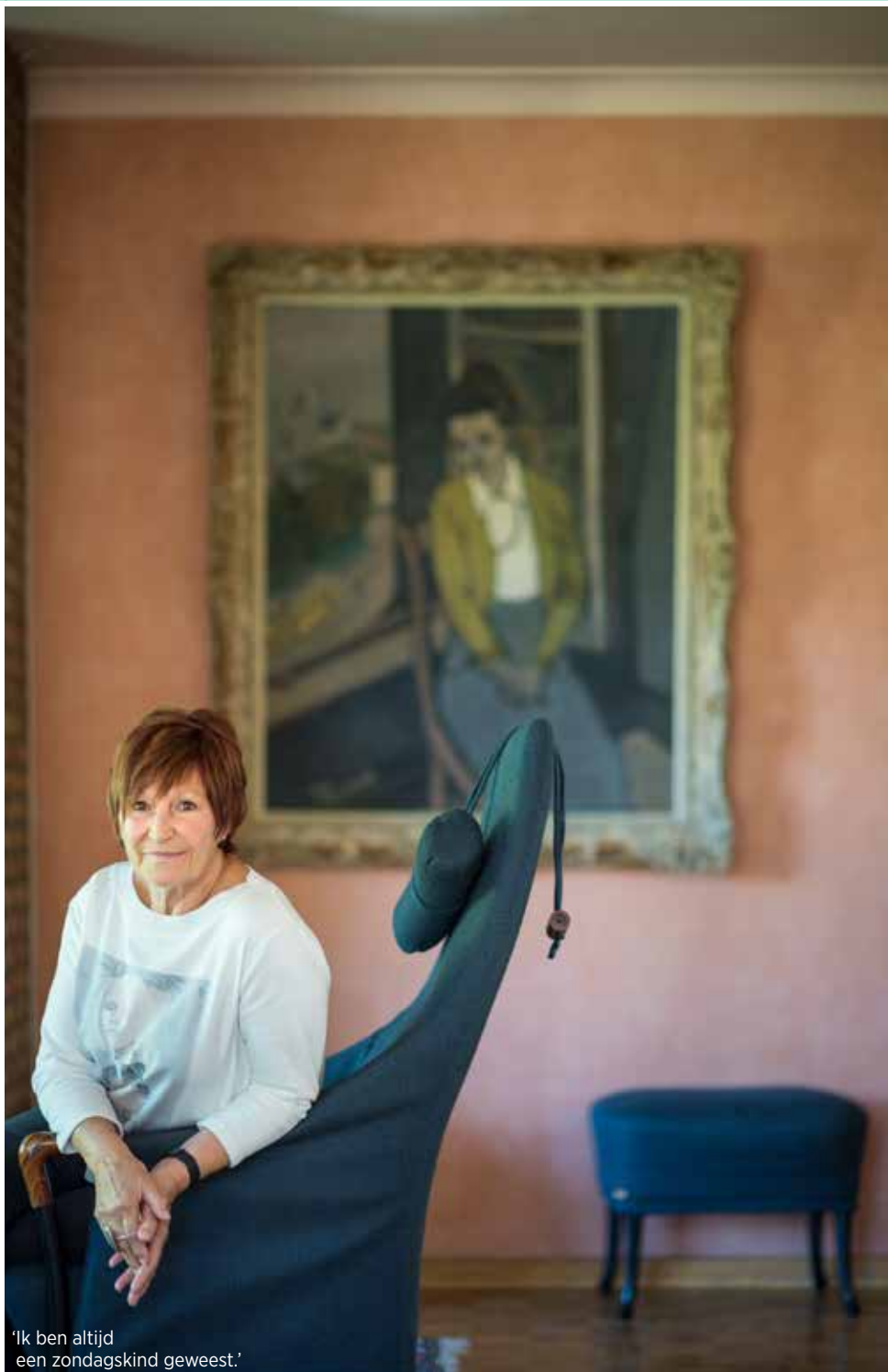
'Ik ben altijd een zondagskind geweest.'

uit. Achter onze wijk lagen weiden met koeien, waar ze in de zomer gingen kamperen. De buurt organiseerde ook allerlei activiteiten. Nu is het hier een beetje doodgebloed. De kinderen zijn al lang het huis uit en de oudere generatie begint meer en meer zijn huizen te verkopen. Er wonen nu veel nieuwe mensen: allemaal lieve en vriendelijke burens, maar we hebben er weinig contact mee. In een buurt met veel kinderen maken zij het contact, hè. Dat is nu heel anders, natuurlijk. Maar ik woon hier nog heel graag en ik hoop dat nog lang te kunnen doen. Veel zal afhangen van de gezondheid, van hoe fit en mobiel je kunt blijven. Dat zal de toekomst uitwijzen.'