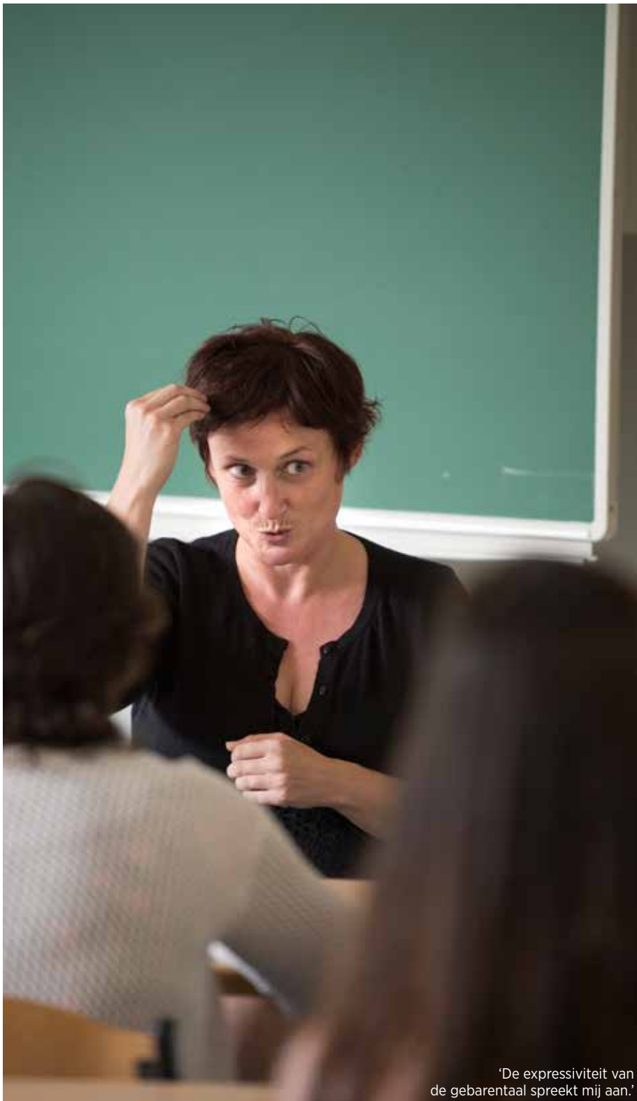
'De expressiviteit van de gebarentaal spreekt mij aan.'