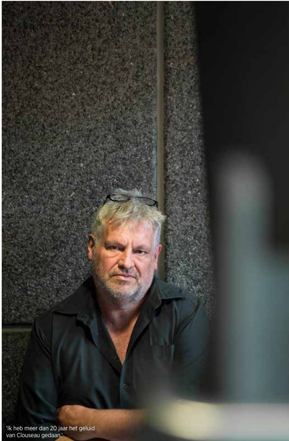
'Ik heb meer dan 20 jaar het geluid van Clouseau gedaan.'