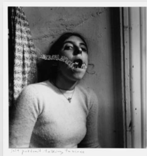
TALKING TO VINCE © FRANCESCA WOODMAN