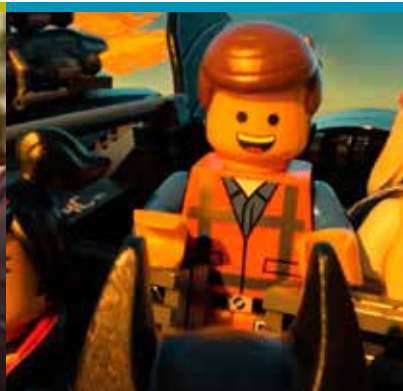
Lego movie (16/04)