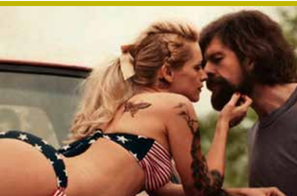
The Broken Circle Bluegrass band (04/04)