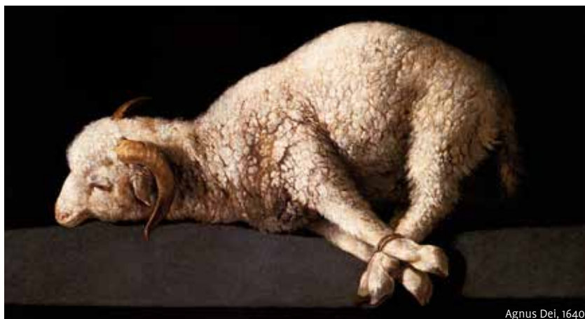
Agnus Dei, 1640