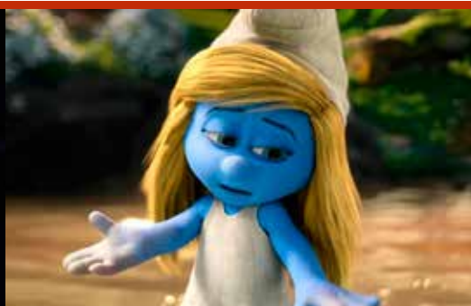
All the way (18/10)