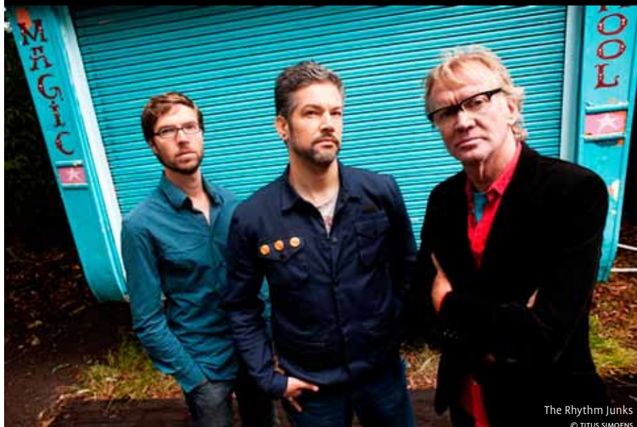
The Rhythm Junks