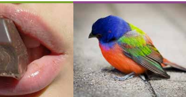
Vogelzang in de Oude Zuunvallei (5/05)

De agenda wordt samengesteld met gegevens uit de Uitdatabank. Organisaties en verenigingen die hun activiteiten opgenomen willen zien in de agenda, moeten ons hun informatie anderhalve maand voor het verschijnen ervan bezorgen. Je kunt de gegevens mailen naar randkrant@derand.be , per brief sturen naar ons redactieadres (RandKrant – UIT in de Rand Agenda, Kaasmarkt 75, 1780 Wemmel) of invoeren in de Uitdatabank via www.uitdatabank.be . Gezien het beperkte aantal beschikbare pagina's wordt bij de aankondigingen prioriteit verleend aan de activiteiten in de gemeenschaps- en cultuurcentra in de Rand. Om voor plaatsing in aanmerking te komen, worden de andere activiteiten vooral beoordeeld op hun uitstraling naar alle inwoners van de Rand. Het volledige vormingsaanbod van Arch'educ vind je op www.archeduc.be .