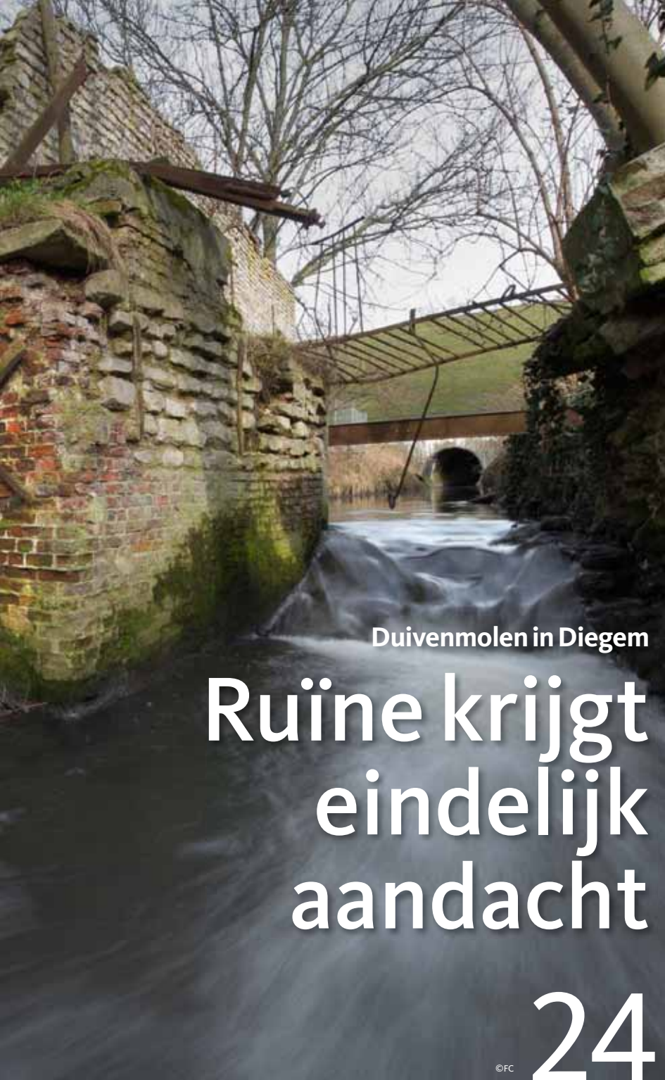
Duivenmolen in Diegem