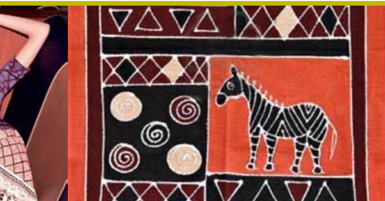
Acoustic Afrika (20/03)