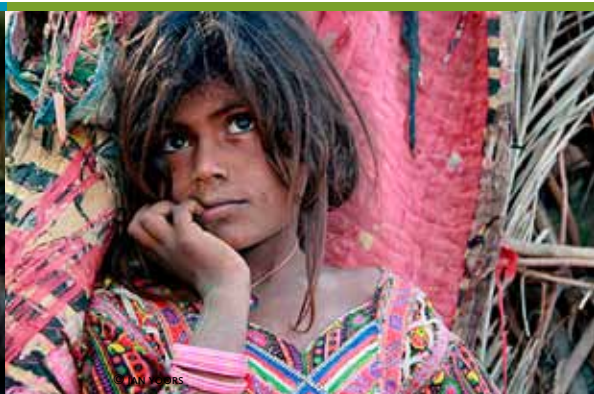
Gujarat, onbekend India (6/02)

De agenda wordt samengesteld met gegevens uit de Uitdatabank. Organisaties en verenigingen die hun activiteiten opgenomen willen zien in de agenda, moeten ons hun informatie anderhalve maand voor het verschijnen ervan bezorgen. Je kunt de gegevens mailen naar randkrant@derand.be , per brief sturen naar ons redactieadres (RandKrant – Uit in de Rand Agenda, Kaasmarkt 75, 1780 Wemmel) of invoeren in de Uitdatabank via www.uitdatabank.be . Gezien het beperkte aantal beschikbare pagina's wordt bij de aankondigingen prioriteit verleend aan de activiteiten in de gemeenschaps- en cultuurcentra in de Rand. Om voor plaatsing in aanmerking te komen, worden de andere activiteiten vooral beoordeeld op hun uitstraling naar alle inwoners van de Rand. Het volledige vormingsaanbod van Arch'educ vind je op www.archeduc.be .