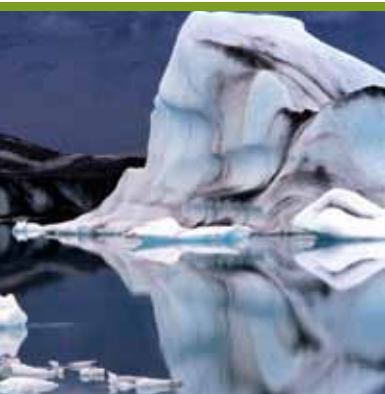
An Evening with Laika (26/01)