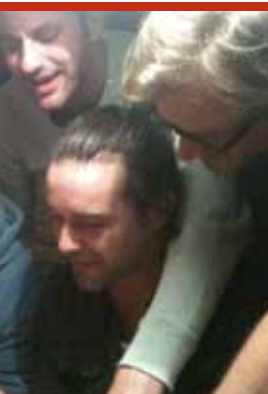
Belpop Bonanza (19/01)