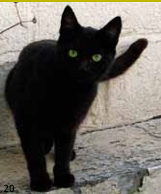
Colors (6/9 tot 23/9)