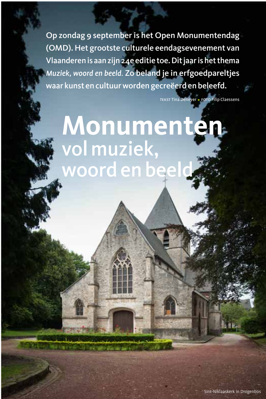
Sint-Niklaaskerk in Drogenbos