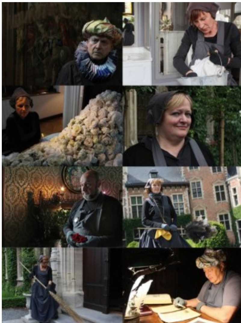
Performers, foto's Ana San Sebastián Blanco

Van 7 tot 19 april organiseerden de teamleden van WildWorks dagelijks opleidingen voor de performers en personeelsleden van het kasteel. Aan de hand van verschillende opwarmings- en improvisatieoefeningen leerden zij elkaar kennen en kregen zij het performen in Once upon a Castle onder de knie.