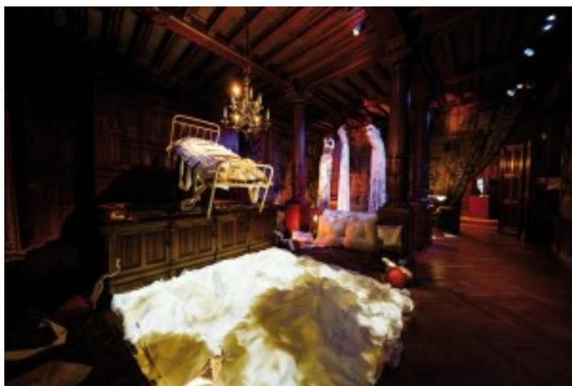
Engelen en demonen, foto Steve Tanner -