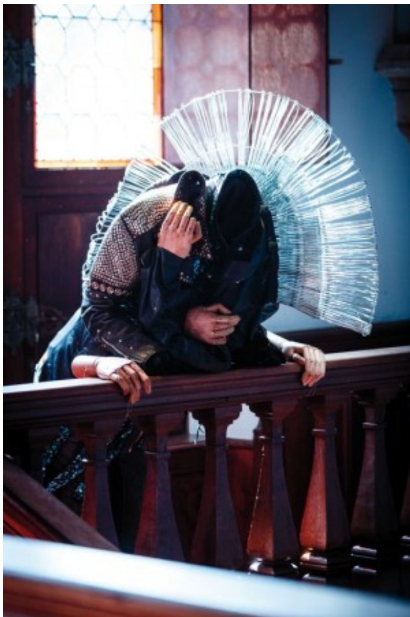
Het huis van Egmond