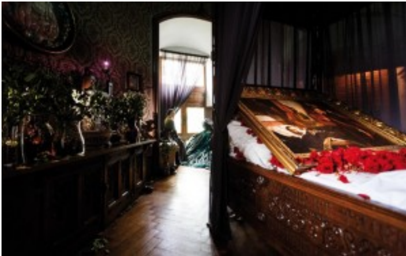
De rouwkamer

De catalogus Once upon a Castle licht de bijzondere aanpak van WildWorks uitgebreid toe en geeft via tientallen foto's een schitterend beeld van hun visueel verbluffende werk in het kasteel. Het boek werd uitgegeven in samenwerking met Stichting Kunstboek. FARO, steunpunt voor erfgoed, gaf een Bijsluiter uit met reflecties en bezoekersanalyse. De CD Once upon a Castle met de composities van Jeroen D'hoë werd uitgegeven in samenwerking met Outhere Music.