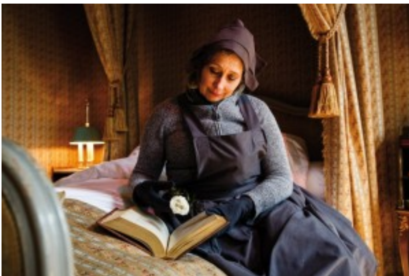
Liefdesgloren, foto Steve Tanner - WildWorks