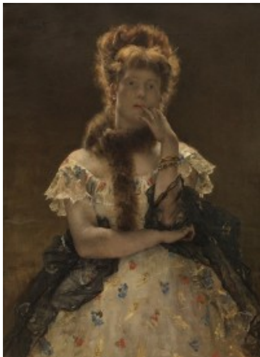
Alfred Stevens, De Parijse sfinks

Eind juni 2012 opende het KMSKA-kunstsalon met een selectie negentiende-eeuwse historiestukken, stillevens, ... uit de collectie van het Koninklijk Museum voor Schone Kunsten in Antwerpen. Met topstukken van o.a. Henri Leys, Henri De Braekeleer, Gustave Wappers, Victor Lagye en Auguste Rodin. In 2014 werd deze selectie aangevuld met werk van Alfred Stevens. Deze expo loopt nog tot 2017.