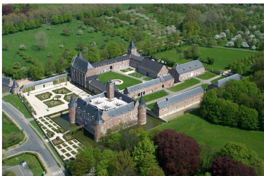
Alden Biesen

De Landcommanderij Alden Biesen [1] is een buitendienst van Kunsten en Erfgoed en kreeg in 2014 211.000 euro dotatie voor haar werking. De infrastructuur wordt beheerd door het agentschap Facilitair Management.