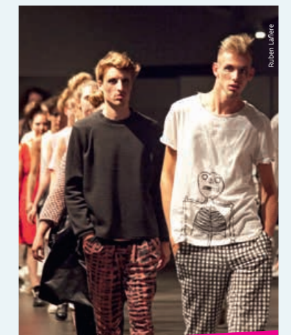
AMILI HAHA. De collectie werd een eerste keer voorgesteld in het Kortrijkse museum Texture.