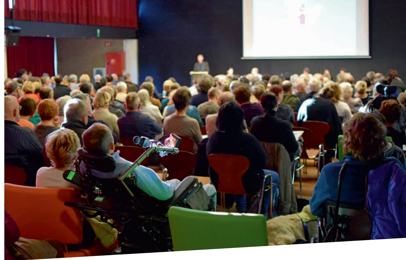
INFOSESSIE IN MALLE. Ongeveer 350 mensen kwamen meer te weten over het reilen en zeilen van de persoonsvolgende financiering.

Ondersteuning door personen of organisaties die niet vergund zijn door het VAPH kun je cash betalen. Kies je voor voucher, dan regelt de zorgaanbieder de betaling rechtstreeks met het VAPH en dan hoeft je zelf niets te doen. Met een voucher houdt de VAPH-zorgaanbieder ook alles bij. Maar betaal je met cash, dan moet je alles kunnen verantwoorden. Of je betaalt met vouchers of cash, is een vrije keuze, dus is het goed dat je over alle nuttige informatie beschikt om die keuze te kunnen maken. Wat kan en wat niet? Bij wie en hoe kan ik mijn budget