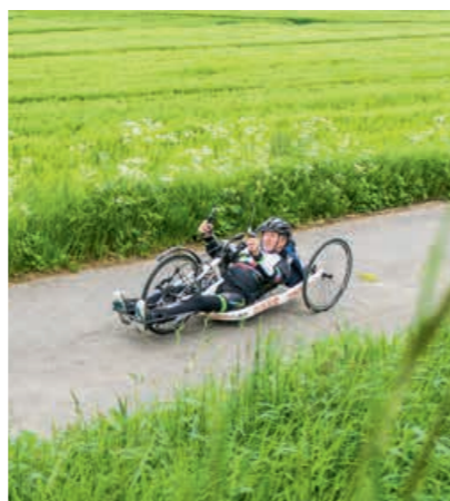
LANGS VLAAMSE WEGEN. In Vlaanderen zijn er aangepaste parcours voor handbikers.

"In Vlaanderen is het ideaal om te mountainbiken. Een helling in het buitenland die zo steil is dat zelfs mountainbikers met twee benen amper boven geraken, lukt voor mij niet. Hier zijn er wel veel vlakke stukken en elke streek heeft zijn voordeel. Op het strand, in het Pajottenland en in de Vlaamse Ardennen train ik mijn weerstand en kracht. In de Ardennen kan ik voluit gaan op langere hellingen. De wielerpiste in Gent is een handige trainingsplek en ook aangepaste parcours voor handbikes en driewielers zijn er voldoende."