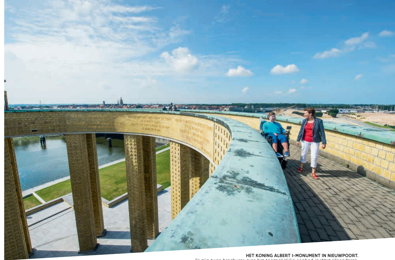
HET KONING ALBERT I-MONUMENT IN NIEUWPOORT. Er zijn twee brochures over het toegankelijke aanbod in West-Vlaanderen.

Mampaey: De interesse neemt toe. Het besef groeit dat mensen met een handicap een interessante doelgroep zijn. Ze nemen steeds meer deel aan het openbare leven, gaan steeds vaker op vakantie en dat doen ze meestal ook nog in gezelschap. Ik vind het boeiend om te zien dat de inclusieve gedachte ook in de toeristische sector leeft. Het streefdoel is duidelijk: op reis gaan moet voor iedereen zo toegankelijk en comfortabel mogelijk zijn. Neem