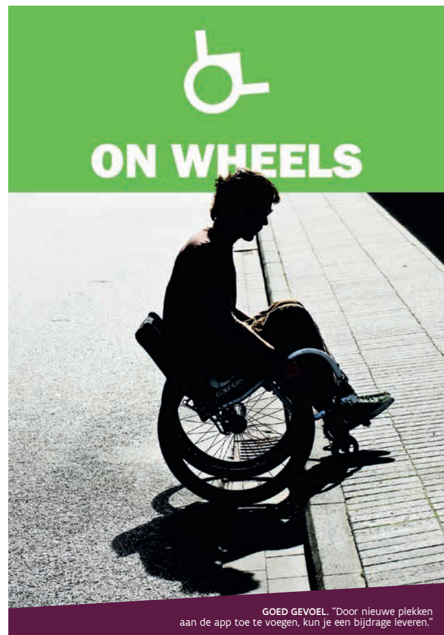
GOED GEVOEL. "Door nieuwe plekken aan de app toe te voegen, kun je een bijdrage leveren."