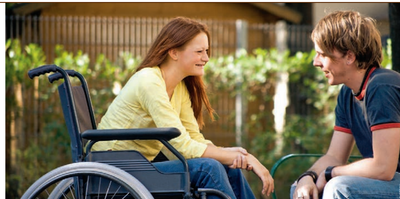
*VAN AANBOD- NAAR VRAAGGESTUURD. Trap 1 van PVF is het basisondersteuningsbudget, een maandelijks, vrij te besteden forfait.

Vandeurzen: "We gaan in ieder geval meer geld inzetten in de VAPH-sector vanaf 2015, maar het decreet voorziet een gefaseerde uitvoering. De omslag van aanbodgestuurd naar vraaggestuurd werken, vraagt heel wat voorbereiding en