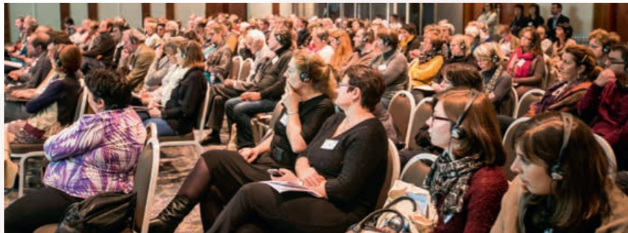
★HET PUBLIEK. Een eerste stap is het bewustzijn vergroten.

Wat verscheidene keren sterk naar voren kwam, is dat inclusie niet hetzelfde is als