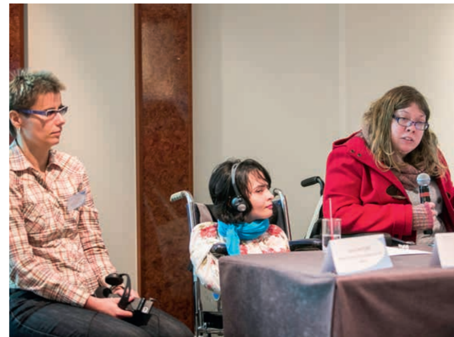
*CONFERENTIE. Ook mensen met een beperking kregen het woord.