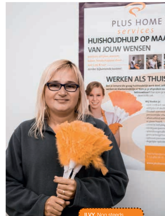
ILVY. Nog steeds graag aan het werk.

Via de jobcoach van de VDAB en de Brailleliga kreeg ze een toestel om zelf haar cheques in te vullen. “Ik krijg dus ook van mijn werkgever hulp. In het begin konden mijn collega's moeilijk geloven dat ik wel degelijk een handicap heb, omdat er aan mijn ogen niets te zien is. Toen is er iemand van de Brailleliga komen praten. Zodra de mensen wisten waarom ik bepaalde dingen niet kon doen, was er wel meer begrip. Intussen doe ik mijn job nog altijd heel graag, en zolang het kan, wil ik dit blijven doen.” *