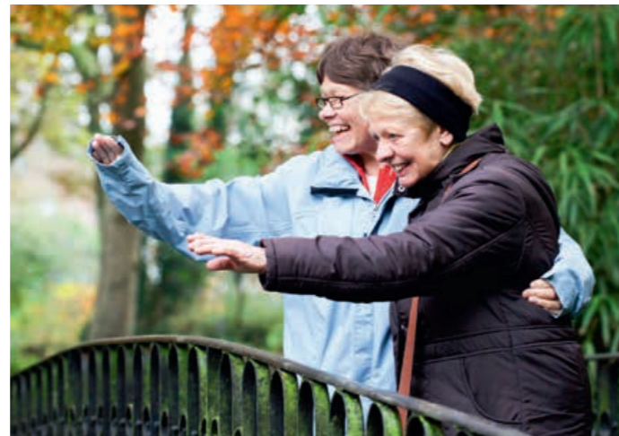
*“Wij babbelen over van alles en nog wat”, aldus de dames.