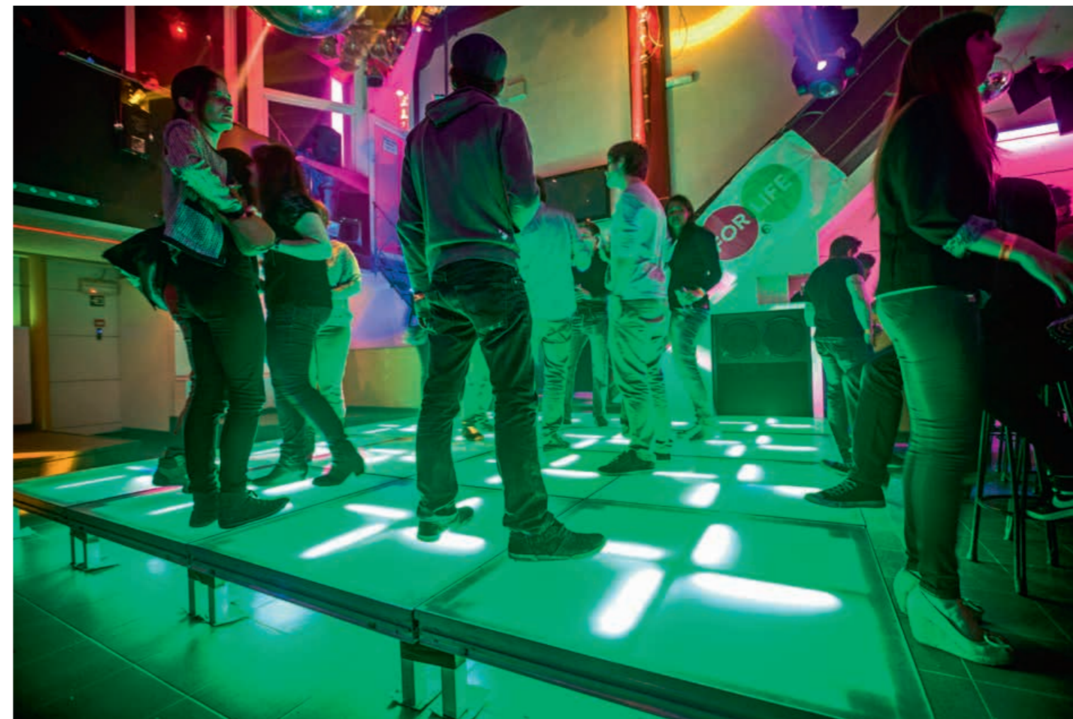
*OP DE DANSVLOER. Luisteren naar de trillingen.

Er kwam meer bij kijken dan voorzien. De trilvloer moest uit Nederland komen, en bleek een grote kost. Om ook de ringleiding te voorzien en de doelgroep te bereiken, hadden de studenten sponsors en partners nodig. Die bleken niet altijd makkelijk te vinden in de wereld van de doelgroep zelf. "We merkten dat de reacties in het algemeen redelijk afstandelijk bleven, wellicht omdat we zelf niet doof zijn en dus ook niet helemaal weten hoe het is. We hadden er zelf weinig affiniteit mee, omdat we ook niet zoveel dove mensen kennen. Anderen waren wel enthousiast, omdat we een van de eersten in België zijn die dit doen. Om uit de kosten te komen, be-