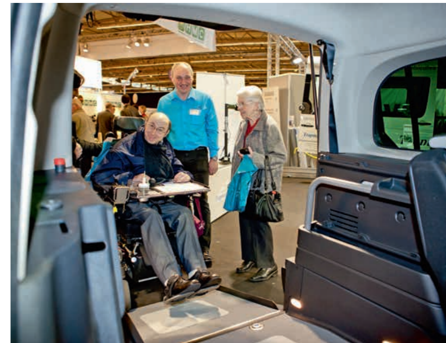
★ONDERSTEUNING. Meer vanuit de vraag dan vanuit het aanbod.

Vandeuren: “Je draagt je rugzak ongeacht je leeftijd, wat zorgcontinuïteit garandeert. En als mensen inderdaad van de ene aanbieder naar de andere gaan, hoeft dat geen ramp te zijn voor de zorgcontinuïteit. Gegevensdeling tussen de zorgverstrekkers, weliswaar met inachtneming van het beroepsgeheim en na toestemming van de betrokkene, kan daaraan verhelpen. Precies daarom hebben we ook het decreet gegevensdeling voorbereid en de ICT-toepassingen in de Vlaamse zorg aangezwengeld. De puzzelstukken voor een vlotte en veilige gegevensdeling in functie van de zorgcontinuïteit liggen klaar. Maar het zal zo’n vaart niet lopen met dat shoppen. Ik ga ervan uit dat de aanbieders zich op een dynamische manier zullen organiseren. Voor een aanbieder wordt het heel belangrijk