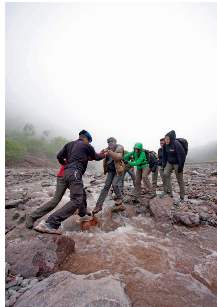
*HULP OP MAAT. “Het nieuwe systeem is een uitdrukkelijke waardering voor wie zorg opneemt.”

“Nog een belangrijke wijziging is dat je in trap 2 een rugzak krijgt die je niet meer moet afleggen op de dag dat je meerderjarig wordt. Die breuk is er dan niet meer. Achteraan in de rij gaan staan voor volwassenenondersteuning hoeft niet meer, maar de omvang en de inhoud van de rugzak worden wel afgestemd op de ondersteuningsnood van het moment.”