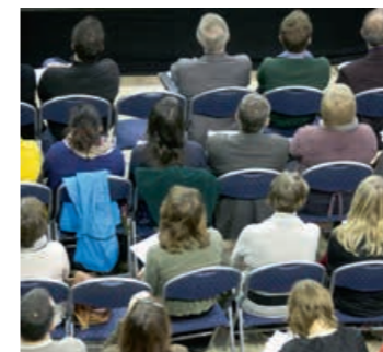
★VAPH-STUDIEDAG. De vorige editie was een groot succes.

De lijst met voorzieningen die rechtstreeks toegankelijke hulp aanbieden, is te vinden op www.vaph.be onder 'wonen en opvang' > 'rechtstreeks toegankelijke hulp'.