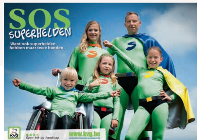
*SOS SUPERHELDEN. De affiche van de campagne.