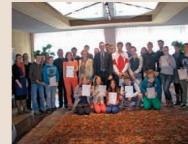
*PRO OPENBAAR VERVOER. Minister Smet met de leerlingen van Berkenbeek.

Met het project 'Op toer met het openbaar vervoer' willen de leerkrachten van het buitengewoon secundair onderwijs Berkenbeek in Wuustwezel hun leerlingen wegwijzen maken in het openbaar vervoer.