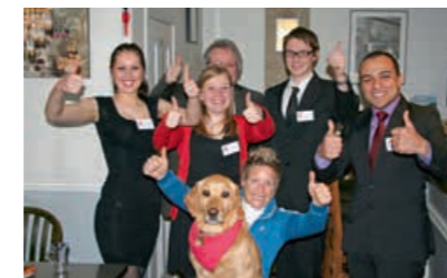
*HANDYCARE. De presentatie van het project.

HandyCare – een project voor een opleidingscentrum voor personen met een beperking – wint de finale van Plan(k)gas.