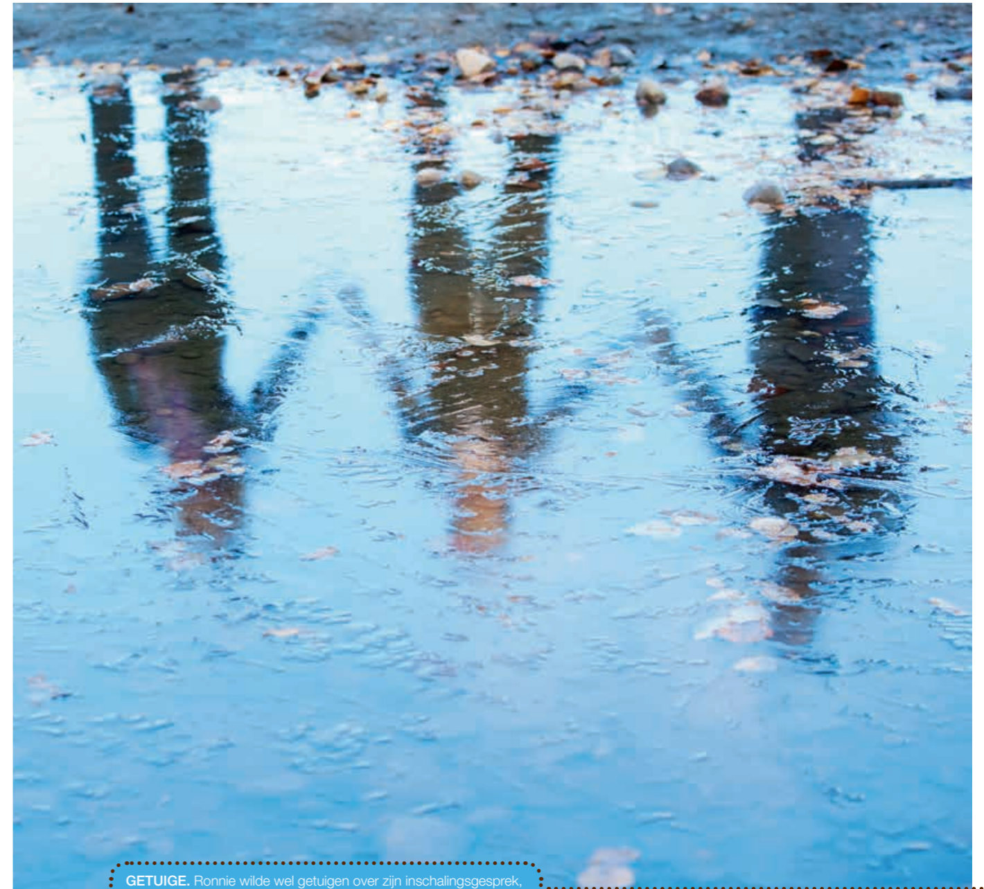
GETUIGE. Ronnie wilde wel getuigen over zijn inschalingsgesprek, maar had liever dat zijn foto niet bij het verhaal werd geplaatst.

Heeft Ronnie het gevoel dat hij zijn zorgbehoeften voldoende heeft kunnen