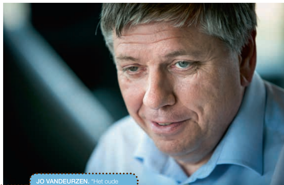
JO VANDEURZEN. “Het oude systeem zou onbetaalbaar worden.”

W e zitten twintig hoog in het kantoortje van de minister van Welzijn, Volksgezondheid en Gezin. Minister Jo Vandeurzen (CD&V) tuurt tijdens het interview geregeld naar een onbestemd punt in de verte. Maar tijd om te dromen, gunt hij zichzelf niet. “We willen nog tijdens deze legislatuur bij decreet vastleggen hoe de ondersteuning in Vlaanderen in de toekomst wordt toegerekend. Het decreet tekent de contouren