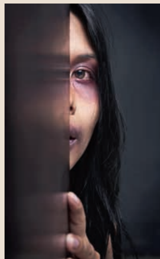
*GEWELD TEGEN VROUWEN. Vrouwen met een beperking zijn extra kwetsbaar.

*Persephone vzw is een organisatie die opkomt voor vrouwen met een handicap of een invaliderende chronische ziekte die het slachtoffer zijn van allerlei soorten geweld.