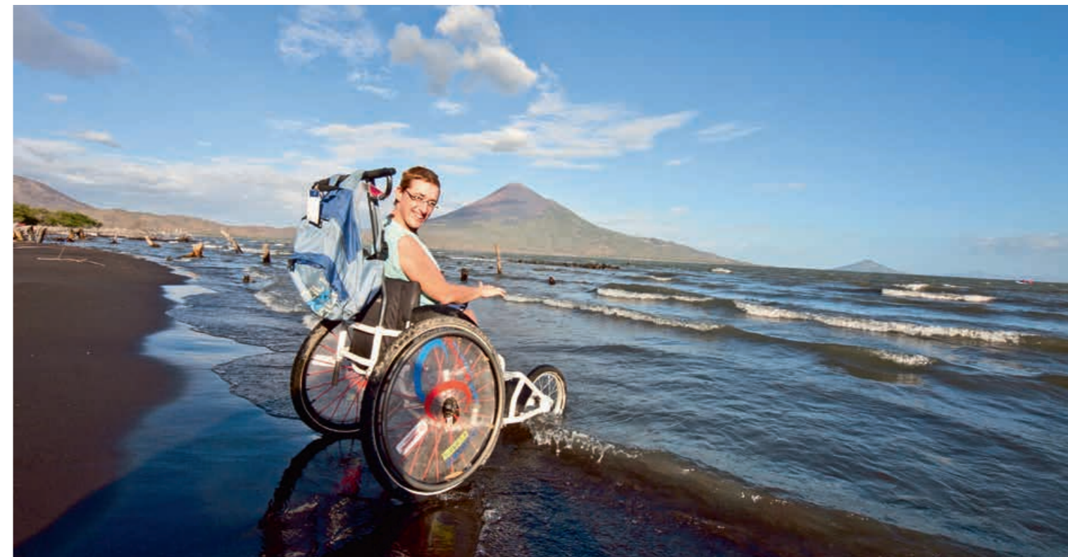
★OP REIS. “Vakantie is een basisrecht.”