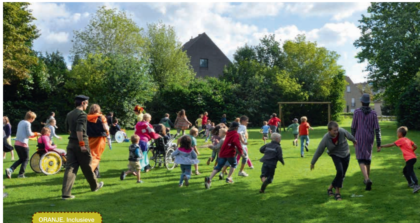
ORANJE. Inclusieve speelpleinwerking.

“INCLUSIVITEIT HOORT IN MIJN OGEN DE NORM TE ZIJN, NIET DE UITZONDERING.”