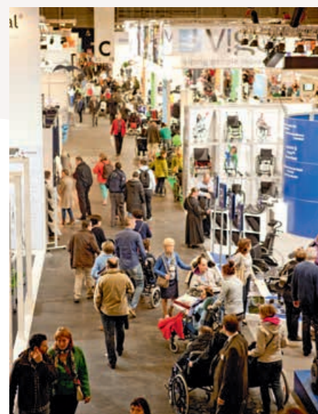
*REVA-BEURS. 15.409 bezoekers.