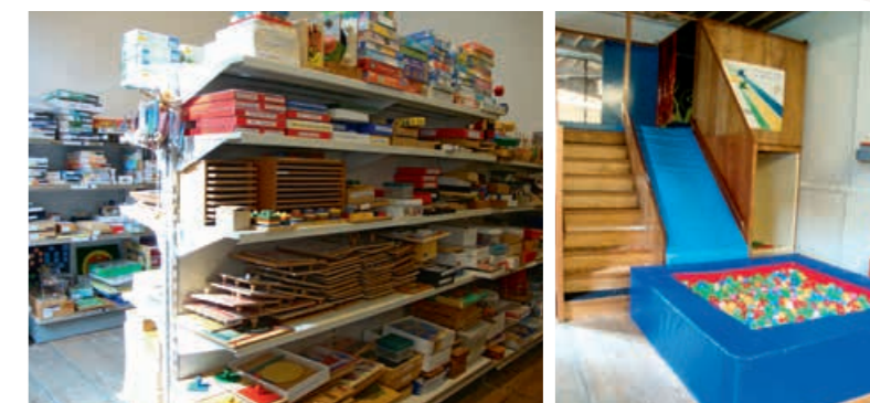
*SPEEL-O-THEKEN. Spelen stimuleert de ontwikkeling van alle kinderen.

Tijdens de schoolvakanties zijn speel-o-theken vaak enkel bereikbaar na telefonische afspraak. Zie www.spelotheken.be