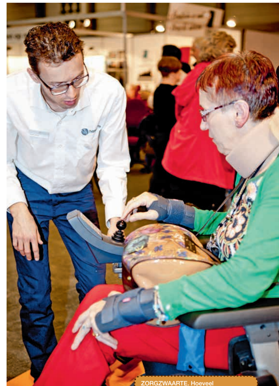
ZORGZWAARTE. Hoeveel ondersteuning heeft een mens nodig?

De inschalers zijn van mening dat het huidige zorgzwaarte-instrument een goed beeld van de ondersteuningsnoden oplevert. Veroniek: “Bij een inschrijving hoort nu ook wel al een multidisciplinair verslag en daarbij worden verschillende domeinen objectief bevraagd. Maar met