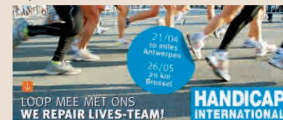
*10 MILES. Het VAPH loopt voor kwetsbare en andere burgers.

Alle lopers die lopen voor u, en voor wie dit niet meer kan, laten zich sponsoren per gelopen kilometer. De opbrengst gaat naar de projecten van Handicap International, waarvoor ook het We Repair Lives-team loopt.