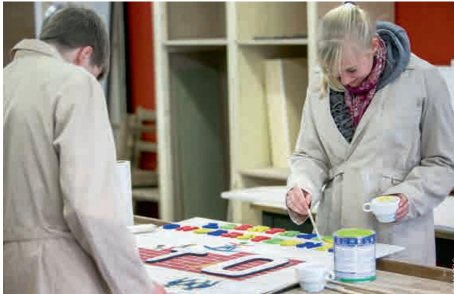
★HET HOUTATELIER VAN HET OLO IN BRASSCHAAT. “Omdat we altijd nog kunnen bijsturen, zien we veel minder onrust.”