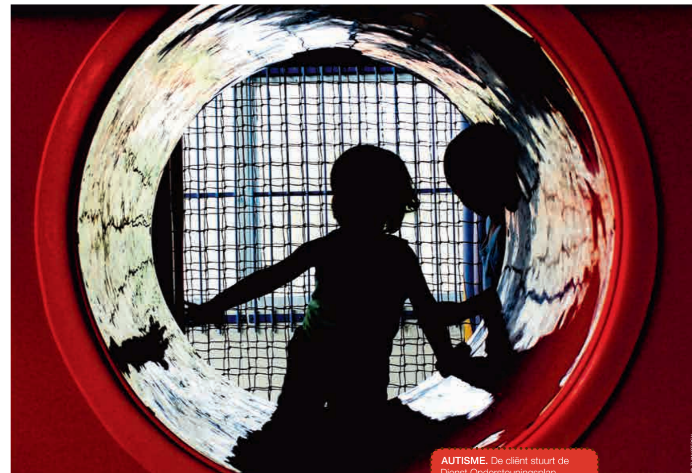
AUTISME. De cliënt stuurt de Dienst Ondersteuningsplan.