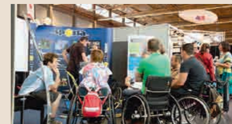
*REVA-BEURS. Het antwoord op al je vragen.

Wie vragen heeft over dienstverlening of op zoek is naar het juiste hulpmiddel, vindt heel wat antwoorden op de REVA-beurs. De informatiebeurs voor mensen met een beperking richt zich op zowel mensen met een kleine beperking als met een meer ingrijpende handicap, van professionele hulpverleners tot mantelzorgers en familie. Ook het VAPH en KOC (Kenniscentrum Hulpmiddelen) zijn aanwezig op de beurs met een infostand. REVA vindt plaats op 25, 26 en 27 april in Flanders Expo Gent. De inkom bedraagt 5 euro. Je kunt een vrijkaart downloaden via http://reva.eventplus.be . Meer info vind je op www.reva.be .