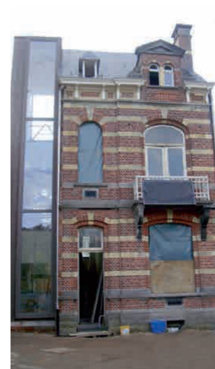
*HET UD WOONLABO IN AANBOUW. "We hebben geluisterd naar de toekomstige gebruikers."