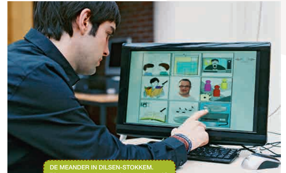
DE MEANDER IN DILSEN-STOKKEM. “Het computersysteem werkt emanciperend.”

“ALS ORGANISATIE GEBRUIKEN WE DIT PLATFORM DAGELIJKS. DAARDOOR HOUDEN WE HET BOEIEND VOOR ONZE INWONERS.”