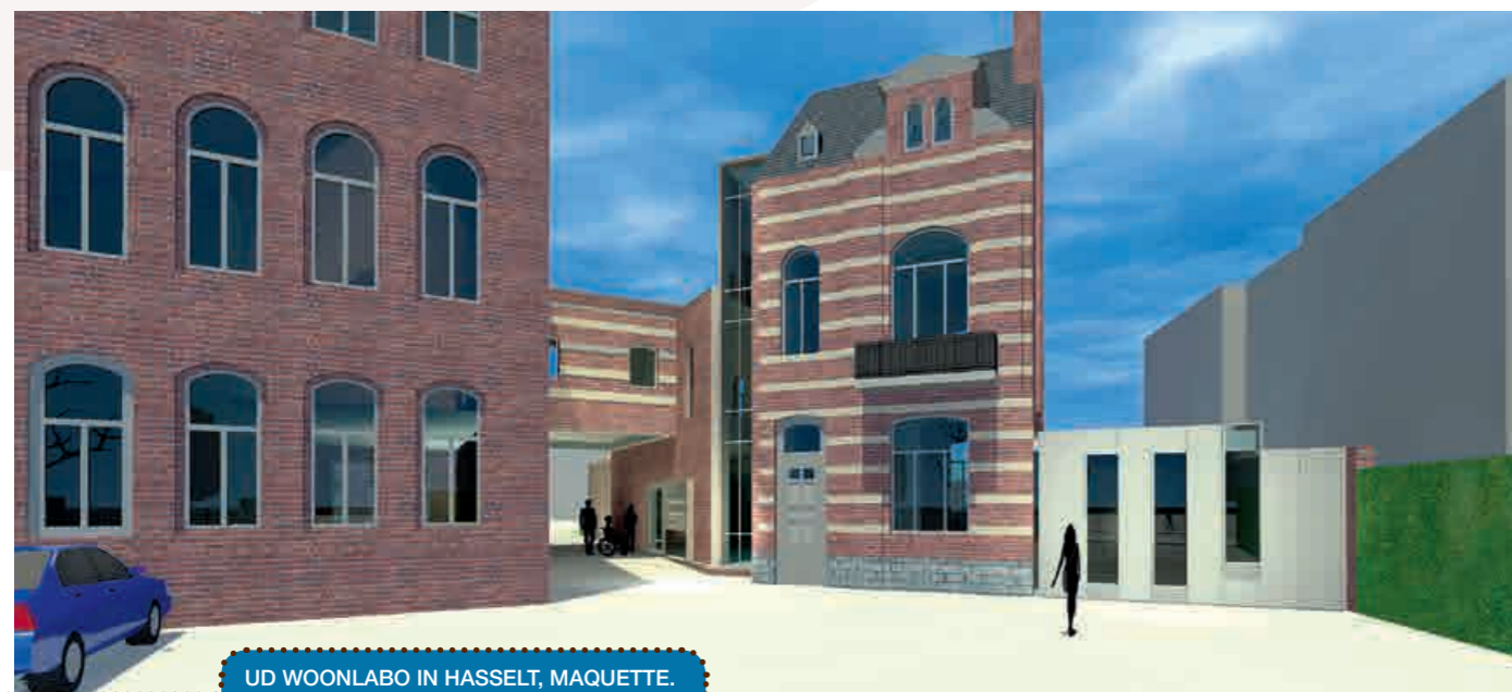
UD WOONLABO IN HASSELT, MAQUETTE. Wonen zonder obstakels.