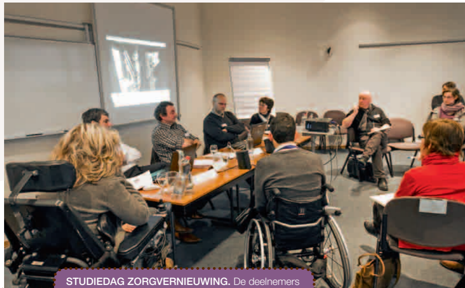
STUDIEDAG ZORGVERNIEUWING. De deelnemers wisselen ervaringen uit tijdens een workshop.

Het VAPH greep de Internationale Dag van Personen met een Handicap aan om in Leuven een studiedag over zorgvernieuwing te organiseren. Het uitwisselen van ervaringen stond er centraal.