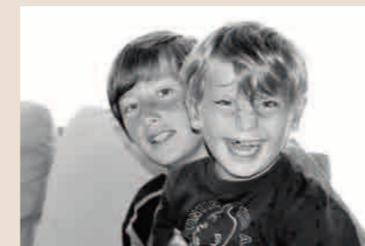
*TANDEM VZW. Hoe omgaan met een verstandelijke beperking?

In een heldere brochure legt De Tandem vzw uit wat de concrete impact precies is. De brochure bevat ook veel getuigenissen die heel herkenbaar zijn. ‘Mijn kind heeft een licht verstandelijke beperking!? Op weg naar beter begrijpen’ werd uitgegeven bij Garant en kan je bestellen bij De Tandem vzw, Groot Begijnhof 73, 9040 Sint-Amandsberg, post@de-tandem.be , www.de-tandem.be Kostprijs: 5 euro.