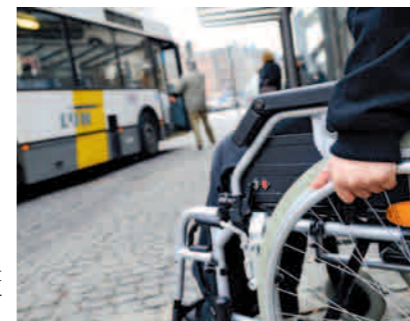
*GRATIS BUS. De Lijn verlengt het gratis abonnement voor personen met een handicap.

Bent u door het VAPH erkend als persoon met een handicap, dan hebt u een gratis netabonnement bij De Lijn. Dat gratis abonnement is geldig tot 31 december, maar De Lijn heeft officieel bevestigd dat het automatisch wordt verlengd. U hoeft daarvoor zelf niets te ondernemen. Rond deze tijd, half december, krijgt u uw nieuwe abonnement thuis toegestuurd.