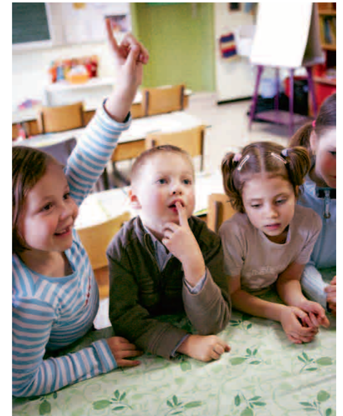
★INCLUSIEF ONDERWIJS. Met denken op korte termijn komen we nergens.

trekkelijk vooruitzicht om in groep na te denken over een verbetering van hun levenskwaliteit. Als dat wel zo is, beginnen we onmiddellijk met de activering van het sociale netwerk. We zoeken eerst een vrijwillige P.L.A.N.-medewerker die in de buurt van de persoon woont en als bruggebouwer met de samenleving fungeert. Daarna wordt de steungroep samengesteld.”