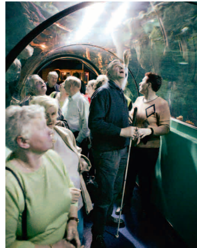
★INCLUSIEVE CULTUURBELEVING. Inclusie is een kwestie van waakzaam zijn en kansen grijpen.

Per jaar start P.L.A.N. ruim honderd van dergelijke processen op. “Mensen melden zich aan en in een gesprek peilen we of de vorm die wij bieden, geschikt is voor de persoon in kwestie. Sommige mensen vinden het namelijk geen aan-