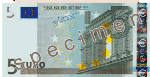
*NIEUW BIJLET VAN 5 EURO. Gebruiksvriendelijk voor mensen met een visuele beperking.

www.ecb.europa.eu/euro en www.newfaceoftheeuro.eu