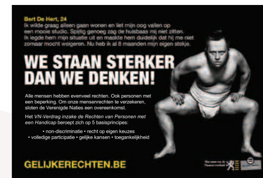
*CAMPAGNEBEELD. Mensen met een beperking moeten weten dat ze dezelfde rechten hebben.