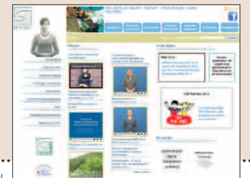
*WWW.FEVLADO.BE. Digitale gebarentaal.

Via www.fevlado.be en de toets ‘websites in VGT’ vind je een overzicht van interessante websites in Vlaamse gebarentaal. Die zijn vaak informatief, zoals over de risico's van CO-vergiftiging of over de werking van Liraz, een organisatie die psychotherapie biedt aan doven. Ook organisaties die opkomen voor gelijke burgerrechten zoals GRIP en Vijftact vzw komen aan bod.