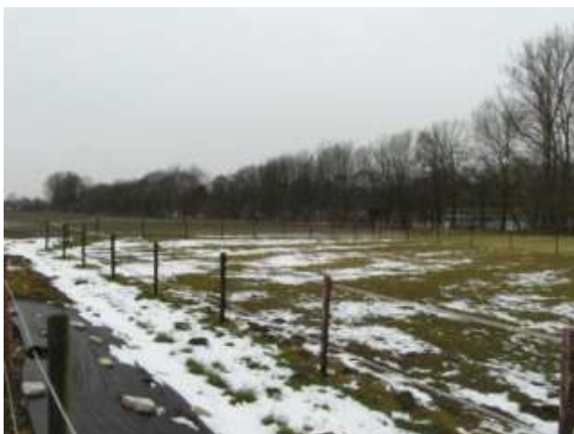
Plaatsen van berging en paardenstal