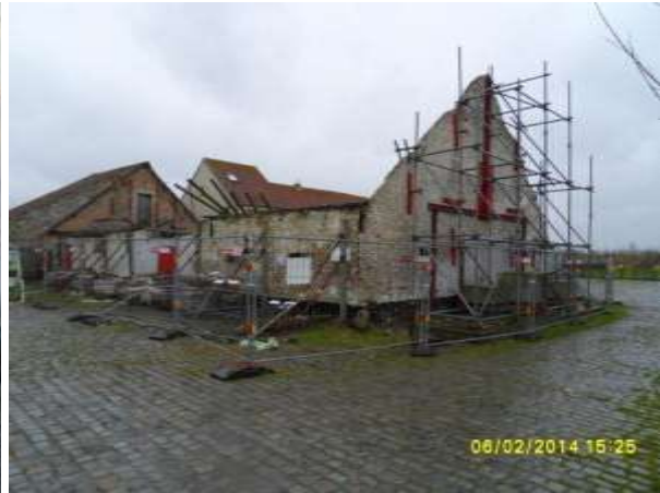
Situatie begin 2014

Oostende, Stuiverstraat, de lange Schuur: nadat in 2009 een proces-verbaal en in 2010 een herstellvordering werden opgemaakt, werd een restauratiedossier ingediend. Dit dossier werd in 2013 voor de heropbouw van de schuur en de restauratie van het nog rechtstaande gedeelte ontvankelijk verklaard. Begin 2014 werd nog niet gestart met de restauratie.