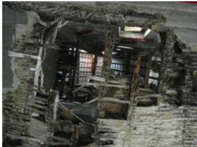
zicht gelijkvloers tot nooddak