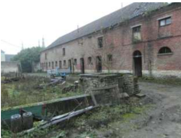
Schrijnwerk beschadigd en plaatselijk niet aanwezig