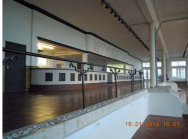
Situatie begin 2014

Oostende, Sportstraat, taverne La Bagatelle: door interieur- en exterieurwerkzaamheden werd het oorspronkelijk architecturaal concept van het monument aangetast. Na het opmaken van een proces-verbaal en herstelvordering werden de eigenaars op 15 december 2009 veroordeeld tot herstel van het pand. Er werd eind 2013 een proces-verbaal van de uitvoering van het vonnis opgemaakt.