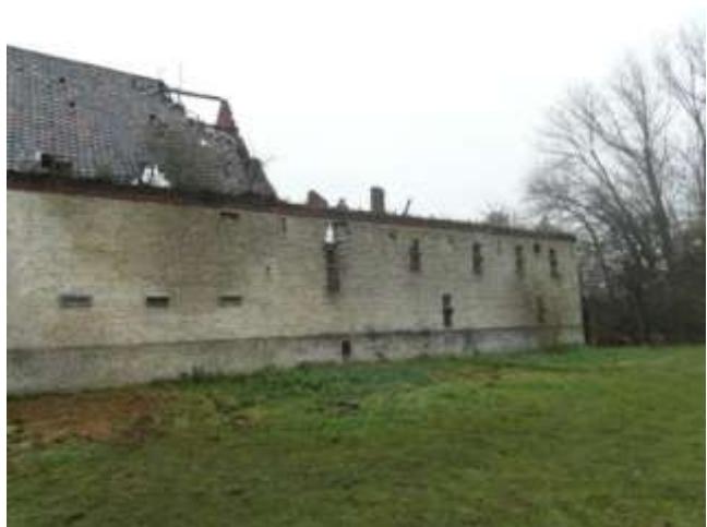
Dak en verdieping ingestort (achterkant gebouw)