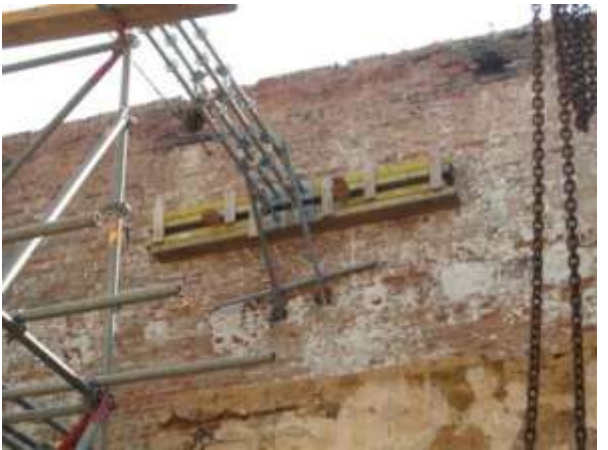
Toestand na het nemen van de opgelegde consolidatiemaatregelen (stutting/schoringswerken)

Sint-Genesius-Rode, "Blarethoeve" : Het betreft een inbreuk van ernstige verwaarlozing die vele jaren geleden werd vastgesteld. Er werden in het verleden verschillende processen-verbaal Onroerend Erfgoed én Ruimtelijke Ordening opgemaakt waaronder het laatste in 2013 met stakingsbevel VCRO.