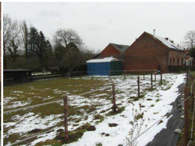
plaatsen van zonnepanelen op de woning