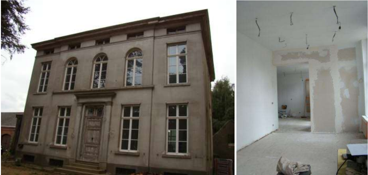
Mechelen, Kasteel Moyson: Werken in uitvoering aan het kasteel Moyson en de bijgebouwen. Er werd een stakingsbevel Ruimtelijke Ordening en Onroerend Erfgoed opgelegd.