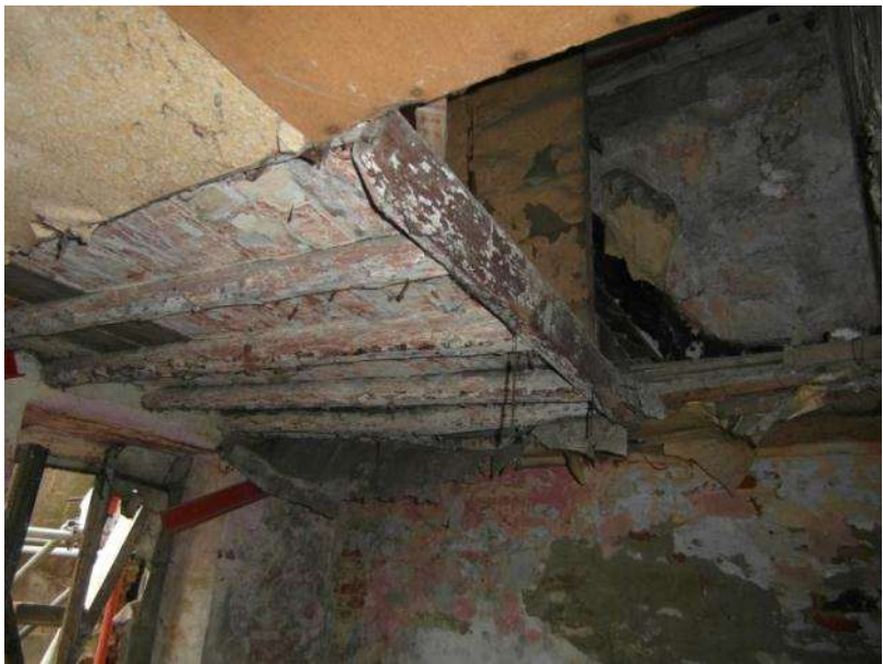
Gedeelten plafond en vloeren verdwenen

Tienen, voormalig Sint-Janshospitaal: op vraag van het agentschap Onroerend Erfgoed werd een onderzoek ter plaatse uitgevoerd, waarbij de ernstige verwaarlozing van het pand kon worden vastgesteld, zowel wat betreft het interieur als het exterieur. In 2013 werd een proces-verbaal opgesteld en voor de opmaak van de herstellvordering zal de ondersteuning van een extern stabiliteitsingenieur worden ingeroepen. Ondertussen werd wel een volledige schoring van het pand en een nooddak gerealiseerd.