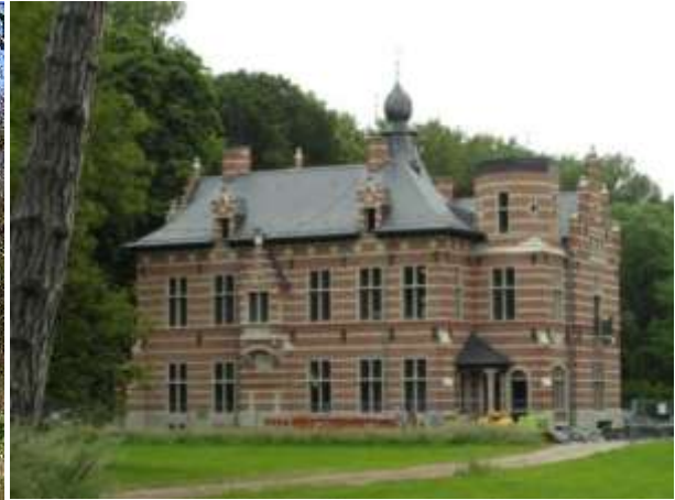
Spontaan herstel in uitvoering

Zaventem (Sterrebeek), Kasteel “Hof ter Meeren” : door de lokale politie werd in 2006 een aanvankelijk proces-verbaal opgemaakt, hetwelke werd geactualiseerd in 2013 door het agentschap Inspectie RWO. De aanvankelijke herstelvordering van 2007 is begin 2014 geactualiseerd. Momenteel is een spontaan herstel van het kasteel in uitvoering.