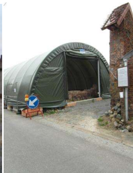
Herstel Fase 1: dringende instandhouding