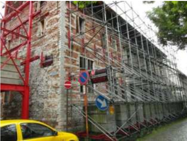
Stutting van de gevels