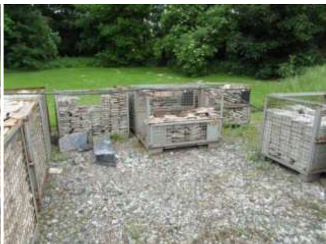
Onverantwoorde opslag van originele vloertegels van het interieur van het kasteel “Hof ter Meeren” (in open lucht zonder beschutting tegen ongunstige weersomstandigheden)

Zaventem – Sterrebeek, Hof ter Meeren: op basis van een klacht van het agentschap Onroerend Erfgoed werd een onderzoek ter plaatse uitgevoerd naar verwaarlozing. Het wagen- en koetshuis bleken ernstig verwaarloosd. Proces-verbaal werd opgemaakt in 2013, de herstelvordering volgde in januari 2014.