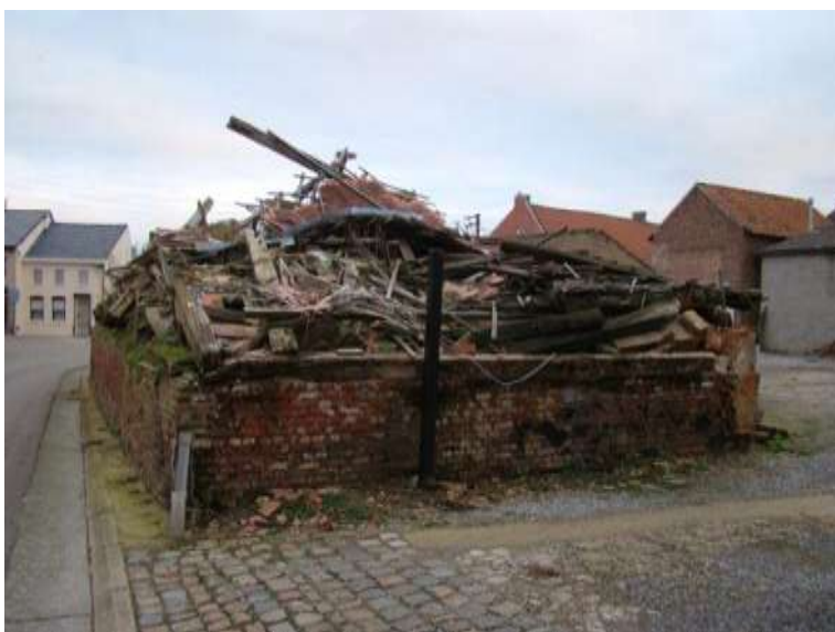
Situatie vóór actie Inspectie RWO

Machelen - Diegem, “Duivenmolen”: Naar aanleiding van een parlementaire vraag werd een onderzoek ter plaatse uitgevoerd waarbij geconcludeerd werd dat de volledige site, door jarenlange ernstige verwaarlozing, is herleid tot een totaal ruïneuze toestand. In 2013 werd een proces-verbaal opgesteld en gezien de vrij complexe toestand ter plaatse werd ervoor geopteerd de herstellvordering uit te besteden aan een extern architectenbureau. Deze opdracht, namelijk het uitwerken van een “basis-restauratiedossier”, wordt eind februari 2014 opgeleverd.