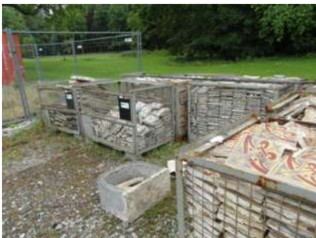
Onverantwoorde opslag originele interieurelementen