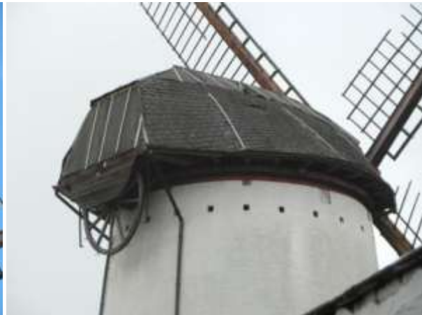
Situatie bij vaststelling uitvoering Fase 1 HV

Aarschot, De Witte Molen beschermd monument: na een klacht van het agentschap Onroerend Erfgoed werd de ernstige verwaarlozing van het interieur en het exterieur van de molen vastgesteld. Bovendien was er een wederrechtelijk aangebouwde constructie aanwezig. In 2011 werd proces-verbaal opgesteld, de herstellvordering werd ingeleid in 2012. In 2013 is een proces-verbaal van uitvoering van de eerste fase (dringende werken) opgemaakt. Het betreft hier een spontaan herstel.