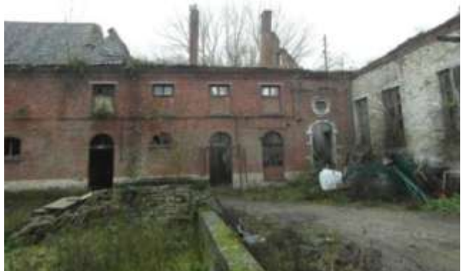
Dak en verdieping ingestort (zicht binnenplaats)