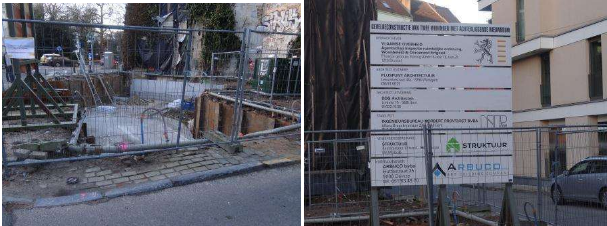
Toestand eind 2013

Gent, Sint-Annaplein: gedurende het laatste decennium van vorige eeuw werden een drietal herenwoningen onrechtmatig gesloopt. Een ambtshalve uitvoering, opgelegd bij arrest, werd in 2010 opgestart. Na het bekomen van de nodige vergunningen werd op 14.01.2013 een openbare aanbesteding gehouden voor de uitvoering der werken. Op 15 augustus 2013 werden de werken opgestart. De huidige stand van zaken (einde 2013) houdt in dat de nodige verstevigingen van de bouwput zijn uitgevoerd (berliner-wanden), de vloer van de kelder is uitgevoerd en de nodige wapeningen voor de opgaande wanden van de kelderverdieping zijn uitgevoerd. Het einde der werken is voorzien in 2015. Ook hier is een ingenieur stabiliteit ingeschakeld voor de opvolging van het ontwerp en de uitvoering.