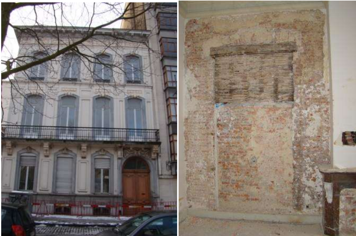
Antwerpen, Huis Bovie: er werd een stakingsbevel opgelegd met betrekking tot het uitvoeren van interieurwerken zonder machtiging van onroerend erfgoed: het ontleisteren van muren, het uitbreken van stenen vloeren,....