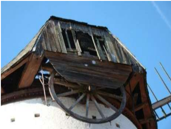
Situatie vóór actie Inspectie RWO