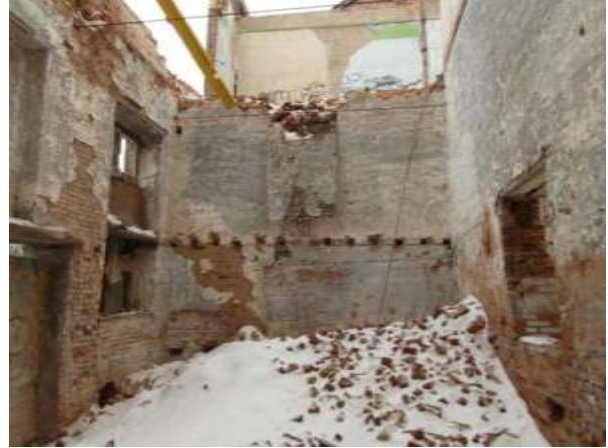
Toestand na instorten muur hoofdgebouw