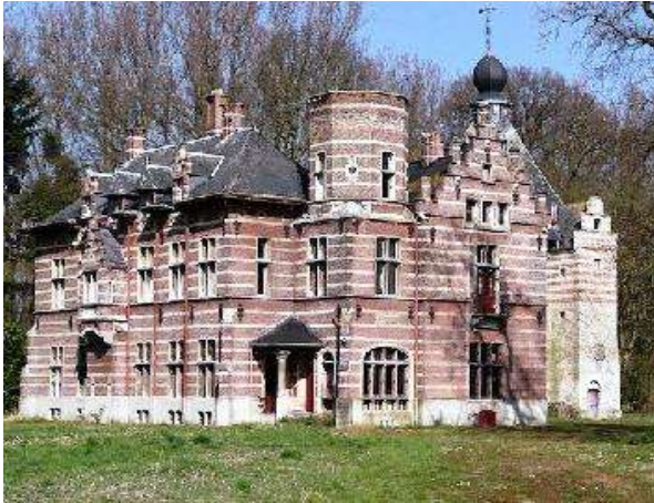
Situatie vóór actie Inspectie RWO