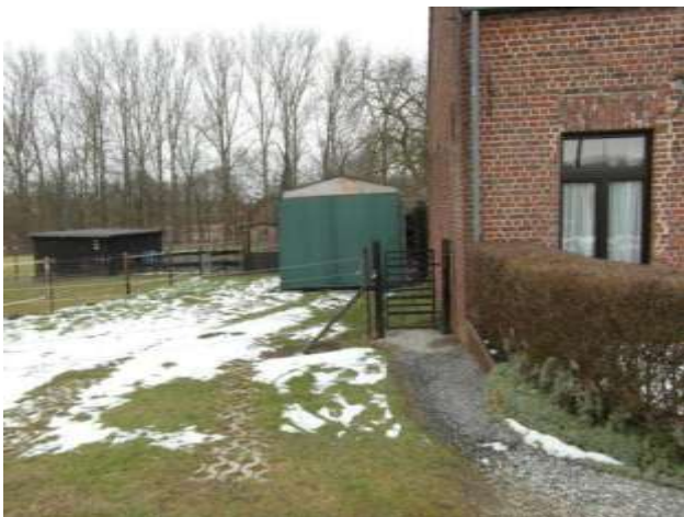
Plaatsen van constructies

Steenokkerzeel, “ Hof te Veaux” : actie n.a.v. een ambtshalve opsporing van het agentschap Inspectie RWO, waarbij een ernstige verwaarlozing van interieur en exterieur werd aangetroffen. Delen van het geheel zijn volledig ingestort (dak en verdieping). In 2013 werd proces-verbaal opgemaakt en in januari 2014 vraagt de eigenaar een restauratiepremie aan om het schrijnwerk en het dak te herstellen.