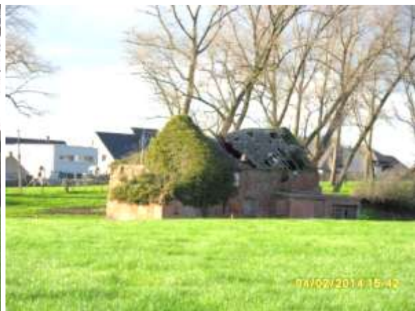
Situatie begin 2014

Beernem, Knesselarestraat, voormalige steenbakkerij: na de opmaak van een proces-verbaal in 2012 werd in 2013 een herstellvordering opgemaakt. Begin 2014 is er een overleg gepland tussen de eigenaar en het agentschap Onroerend Erfgoed. Op het terrein zelf gaat de toestand anno 2014 verder achteruit. Zoals eerder vermeld, beschermen gesprekken met Onroerend Erfgoed de verwaarlozer echter niet tegen een veroordeling.