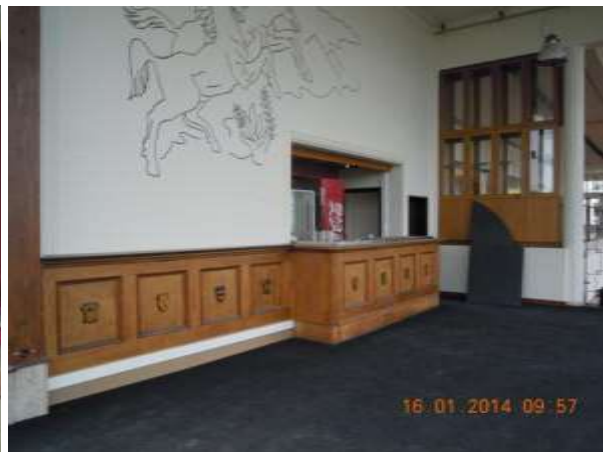
Situatie begin 2014