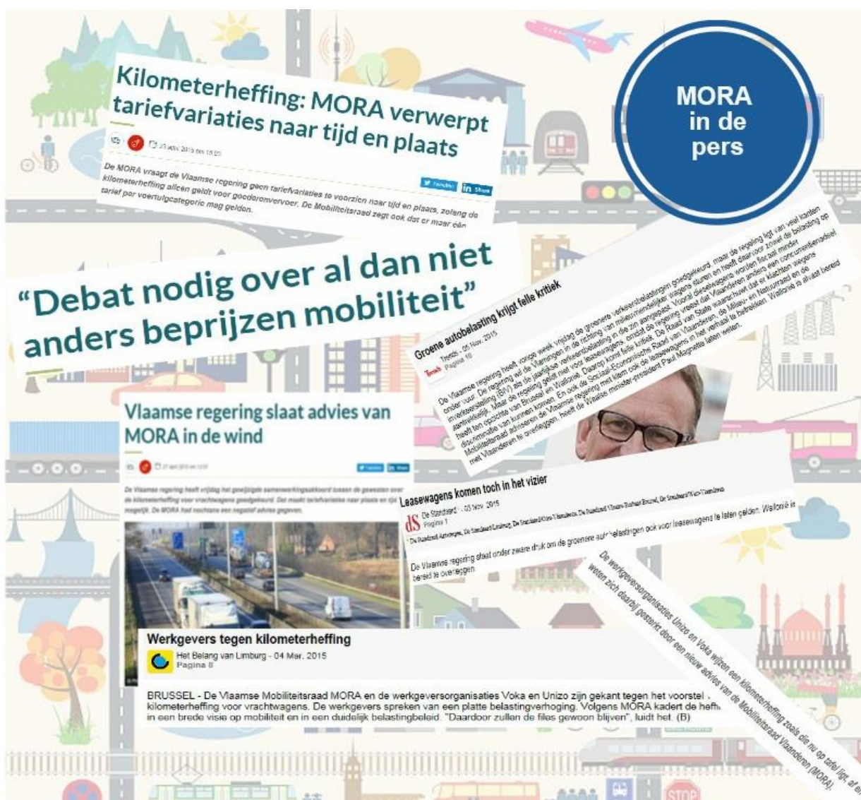
Figuur 1 MORA in de pers