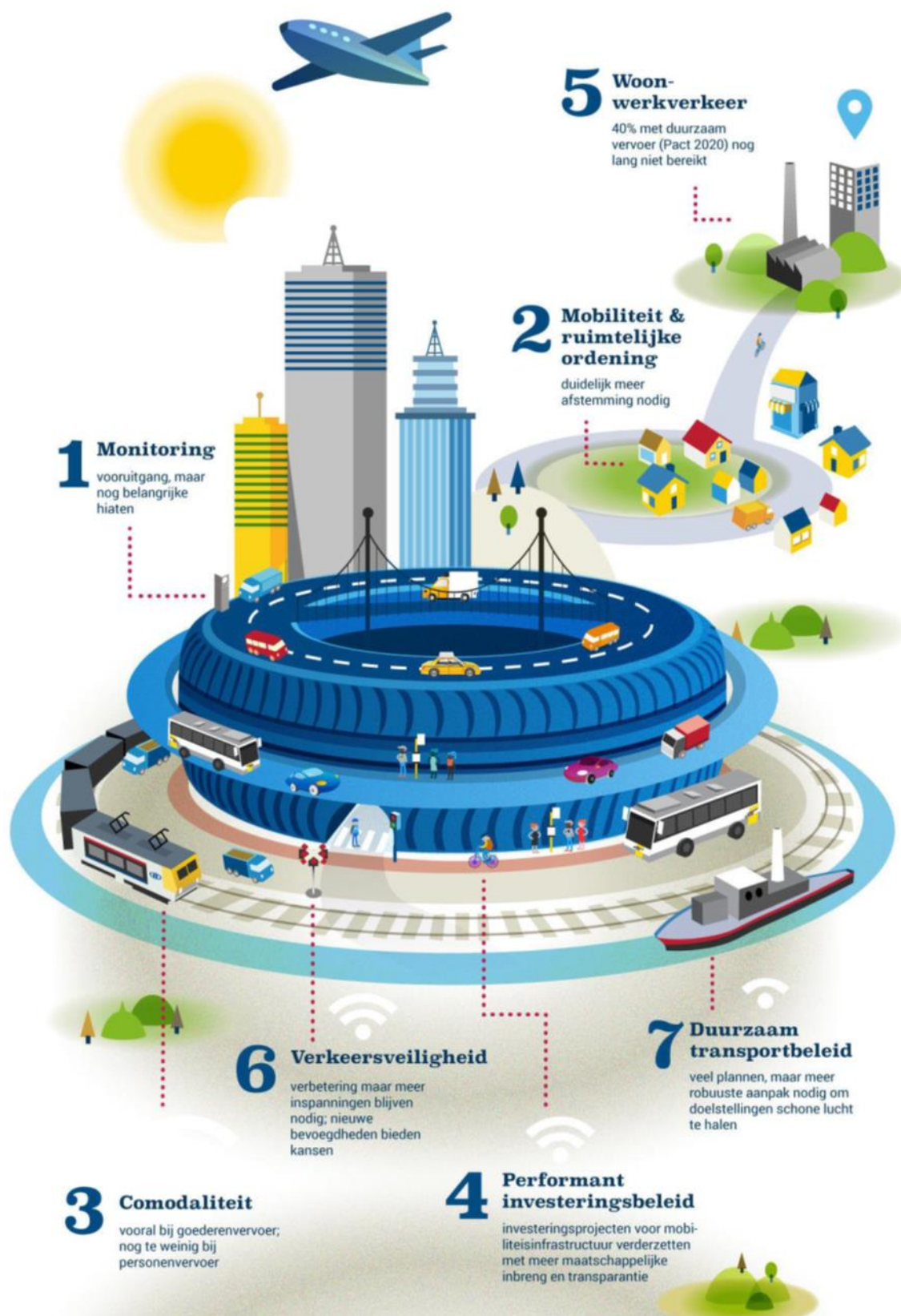
Figuur 2 Aanbevelingen voor het toekomstige Vlaamse mobiliteitsbeleid uit het Mobiliteitsrapport 2014 van de MORA