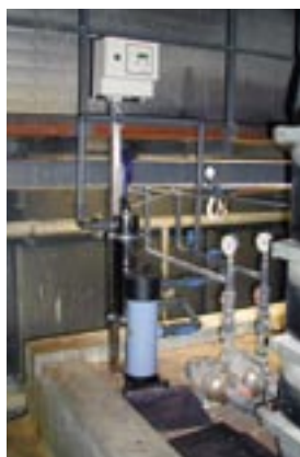
UV-installatie met zakkenfilter.

Bij gebruik van hemelwater als drinkwater voor de dieren doet u er goed aan het water bacteriologisch te behandelen om besmetting uit te sluiten. Dat kan door het gericht chloreren van het water of door toevoeging van waterstofperoxide. In de varkenshouderij wordt chloreren het meest toegepast. Een andere methode is het bacteriologisch afdoden van het water via UV-ontsmetting. Een nadeel daarvan is dat het water bacteriologisch dood is en dat nadien bepaalde organismen enorm snel kunnen groeien. Met een zandfilter krijgt men een onvolledige afdoding en wordt een biologisch evenwicht in het water bewaard.