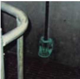
Drinkbakje voor biggen in kraamhok.