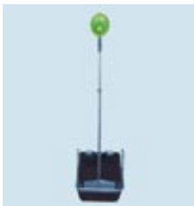
Het drinkwater-vlotter-systeem verzekert een constant niveau in de drinkbakken.