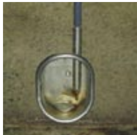
Drinkbak met asymmetrische drinknippel voor gespeende biggen.