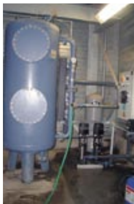
Automatische zandfilter met dosering.