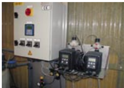
Doseerinstallatie om de waterkwaliteit bij te sturen.

Wordt oppervlaktewater als drinkwater gebruikt, dan moet het water na bacteriologische afdoding extra gezuiverd worden via een actieve koolfilter. Via deze actieve koolfilter worden niet alleen geur- en smaakstoffen uit het water gehaald, maar bijvoorbeeld ook resten van gewasbeschermingsmiddelen. Ondanks alle voorzorgen moet toch heel voorzichtig omgesprongen worden met het gebruik van oppervlaktewater als drinkwater voor het vee. Een actieve koolfilter wordt immers opgebouwd op basis van een bepaalde watersamenstelling. De samenstelling van oppervlaktewater is echter niet constant!