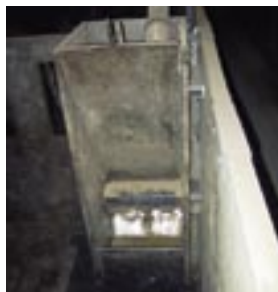
Brijbak voor vleesvarkens.