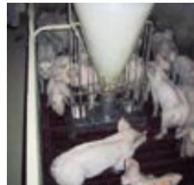
Drinkwater- en voerverstrekking in één bak laten biggen toe om brij te maken.