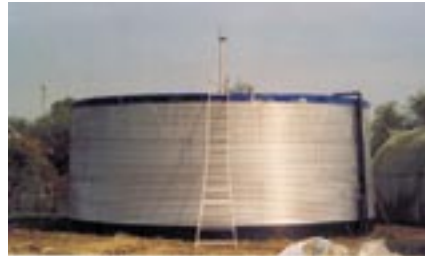
Hemelwateropvang in een metalen silo.

Naast hemelwater blijft een aanvullende waterbron noodzakelijk.