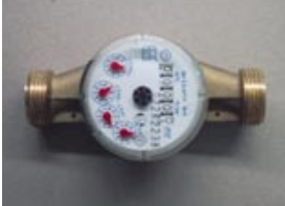
Een debietmeter toont u uw exacte verbruik.

De hoeveelheid reinigingswater meet u zo: ga het debiet van uw hogedrukreiniger na en vermenigvuldig deze met de tijd die u nodig hebt om te reinigen. Om nu de hoeveelheid drinkwater te schatten, trekt u de hoeveelheid reinigingswater af van het volledige watergebruik (geregistreerd door de watermeter bij de grondwaterwinning, de hemelwateropslag of het leidingwaternet).