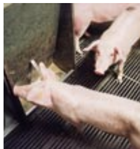
Combi-bak (bevat zowel een voeder- als een drinkbak) voor biggen.