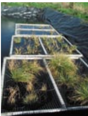
Drijvende vloten om algengroei tegen te gaan.