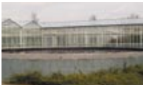
Drijfzeil op foliebassin.

Op een varkensbedrijf wordt hemelwater bij voorkeur opgevangen in een gesloten citerne. Op deze manier wordt algengroei vermeden. Wordt ervoor gekozen om het hemelwater in een bassin of watersilo op te slaan, dan is het raadzaam om het water af te schermen van het zonlicht. Dat kan door op het wateroppervlak een drijfzeil of andere middelen (bijvoorbeeld drijvende kunststofballen of drijvende plantenvloten) aan te brengen. Is het lichtdicht afdekken van het bassin niet mogelijk, dan kan beweging in het waterbassin bijvoorbeeld via beluchting of het rechtstreeks afdoden van algen via een ultrasoon toestel een oplossing bieden.