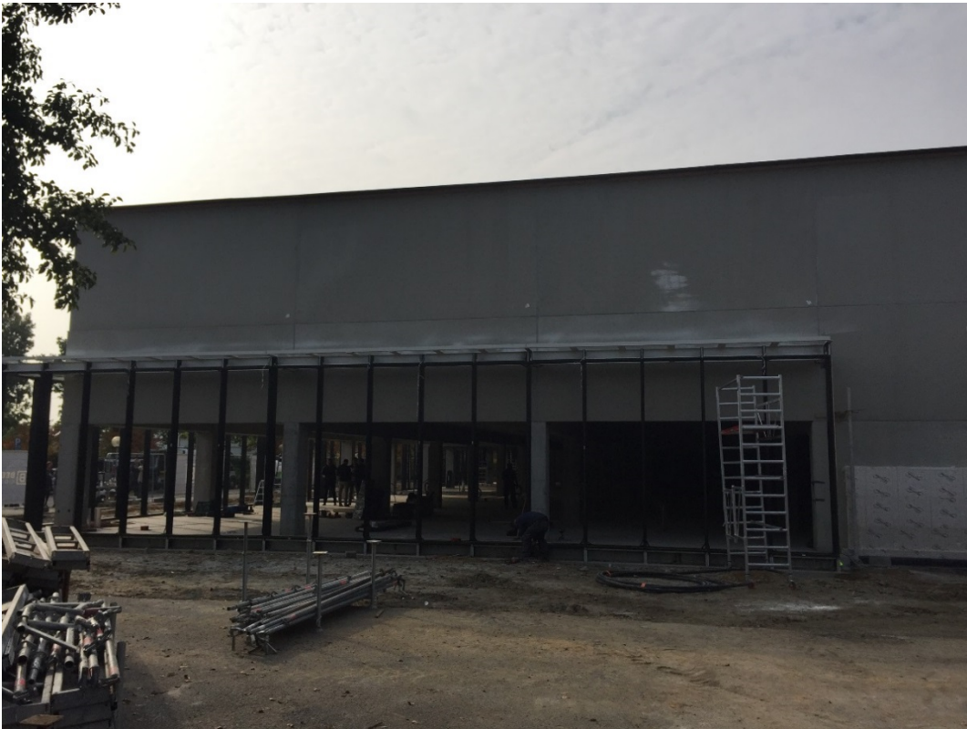
Bouwwerf Regionaal Erfgoeddepot Trezoor Kortrijk in 2017