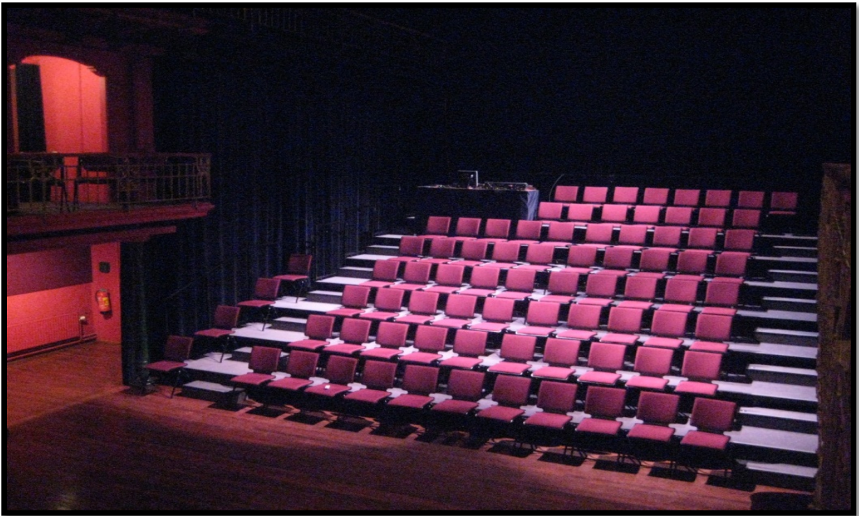
De Brakke Grond Amsterdam kreeg een nieuwe publiektribune voor de Rode Zaal.