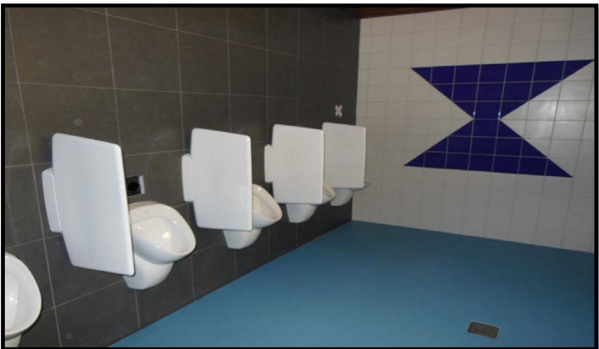
De sanitaire installaties in de Zandloper kregen een opknappbeurt