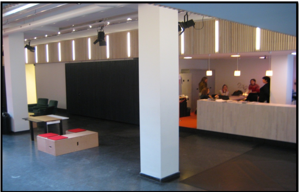
De inkom van de Brakke Grond onderging een renovatie.