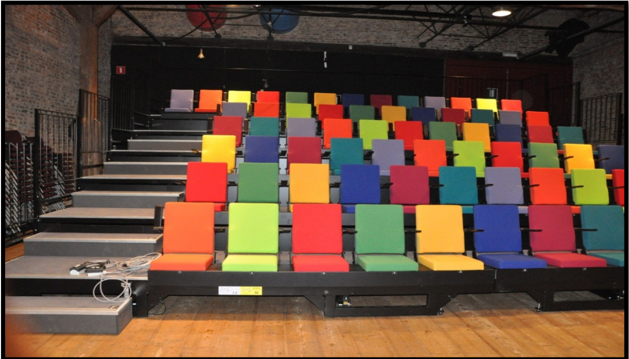
De Boesdaalhoeve kreeg een nieuwe publiektribune.

Grote projecten van vzw De Rand worden vastgelegd via FoCI-middelen. In 2013 kwamen twee projecten tot uitvoering.