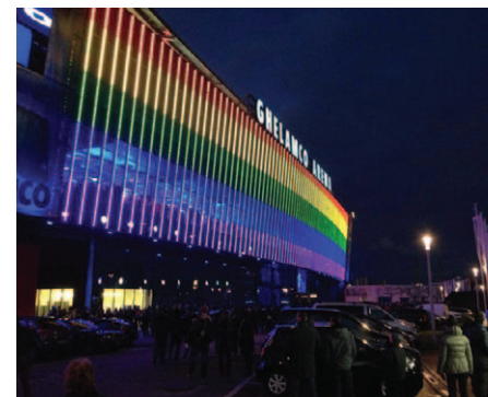
Ghelamco-arena van AA Gent in regenboogkleuren bij de lancering van de campagne 'The only gay in football' (2013).

Bestel posters en flyers, bijvoorbeeld via gavarria, en andere gadgets om te verdelen in de club. Organiseer een campagne tegen homofobie, bijvoorbeeld door in regenboogkleuren naar de wedstrijd te komen kijken of regenboogspandoeken uit te hangen in het stadion.