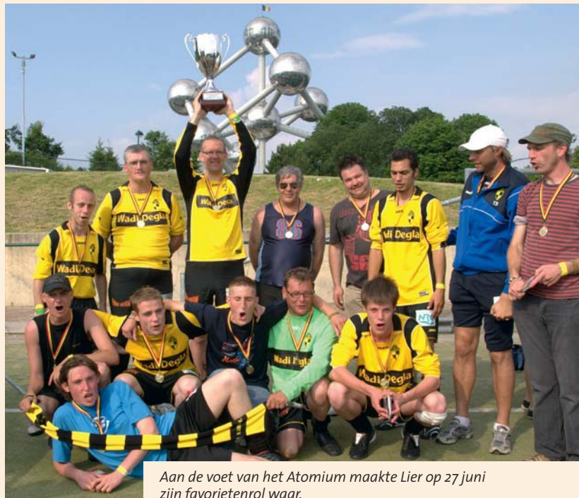
Aan de voet van het Atomium maakte Lier op 27 juni zijn favorietenrol waar.