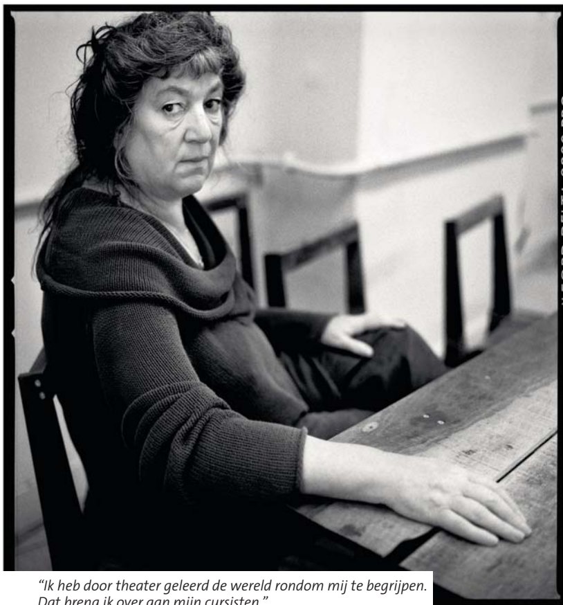
"Ik heb door theater geleerd de wereld rondom mij te begrijpen. Dat breng ik over aan mijn cursisten."

Want er is wel degelijk een drempel: je moet je ziel blootleggen."