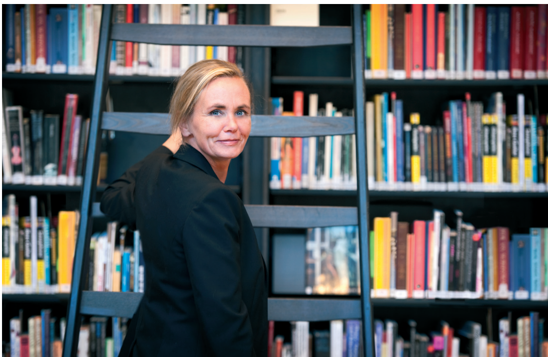
Liesbeth Homans

Homans: "Die mensen organiseren die acties natuurlijk met de beste bedoelingen, want ze hechten oprecht veel belang aan de bibliotheekwerking in Vlaanderen. Ze vrezen dat die werking in de toekomst onder druk zal komen te staan. Het is dus goed dat ze opkomen voor hun zaak. Maar tegelijk weerklinkt een ondertoon van wantrouwen tegenover de lokale bestuurders. Ten onrechte. Onze lokale bestuurders en de lokale ambtenarenkorpsen verdienen dat vertrouwen wél. Daar ben ik van overtuigd."