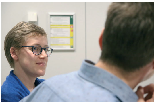
Sarah Meys © ABB.

Jolling: “Met de vrijetijdsmonitor. Na de gemeenteraadsverkiezingen krijgen we mogelijks een belangrijke omslag. Dus het is nu het goede moment om die monitor te lanceren. Na de hele discussie over decentralisatie en na de paritaire commissie willen we sterker inzetten op monitoring en benchmarking. Zo kunnen we vanuit Vlaams niveau de ontwikkelingen goed opvolgen en de lokale overheden adequaat ondersteunen.”