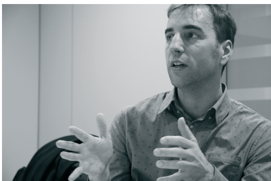
Peter Jolling © ABB.

Meys: “Gedeeltelijk wel. Het is van meet af aan (in 2015) opgevat als een heel participatief traject. Maar we willen de gemeenten ook niet overbevragen. Daarom hebben we alle informatiebronnen die we maar konden vinden, gekoppeld aan de monitor. De lokale besturen kunnen dat verder aanvullen met elementen die ze relevant vinden om zich te benchmarken met andere gemeenten. Daartoe lanceerden we in maart een registratietool. Gemeenten krijgen tot de zomer tijd om hun gegevens van het voorbije jaar in te vullen. Die data ontsluiten wij dan tegen eind 2018 samen met de externe bronnen die we eerder al aanboorden. Je zal die dan in mooie dashboards kunnen raadplegen per vrijetijdsthema.”