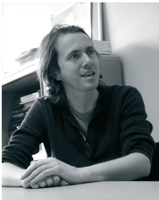
Wouter Van Dooren © ABB.

“Je kan je woonbeleid drastisch hervormen als gemeentebestuur, maar als de lokale huisvestingsmaatschappij niet meestapt in dat verhaal, dan zijn je bestuurlijke armen redelijk kort.”