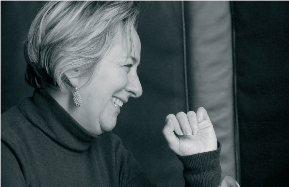
Mieck Vos © ABB.