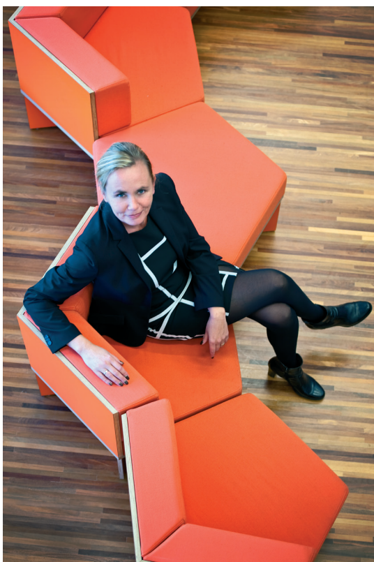
Liesbeth Homans

Homans: "Het eerste jaar van de legislatuur gebruikten we om samen het werkveld te screenen en principiële keuzes te maken over de thema's die we verder zouden uitdiepen en omzetten in concrete decentralisaties. Dat proces leidde tot een eindverslag van de paritaire commissie dat de Vlaamse Regering op 26 juni 2015 bekrachtigde. Nadien gingen verschillende werkgroepen aan de slag om de intenties te concretiseren. Ook die werkgroepen waren paritair samengesteld met telkens delegaties van de Vlaamse Regering, de VVSG en de provincies. Het bevoegde Vlaamse kabinet nam steeds het voorzitterschap van de werkgroepen waar."