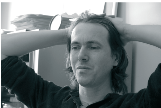
Wouter Van Dooren

Van Dooren: “Ook Nederland decentraliseerde veel bevoegdheden. De decentralisatiebeweging in Nederland krijgt nu wel wat kritiek. Daarom is het goed om naar onze noorderburen te kijken vooraleer we verder hervormen. Werkzoekenden in Rotterdam zullen bv. strenger aangepakt worden dan in Eindhoven. Nu rijst in Nederland de vraag of dat nog wel rechtvaardig is. Maar als je decentraliseert dan moet je ermee om kunnen dat de dienstverlening in de gemeenten onderling gaat verschillen, anders heeft die operatie geen zin.”