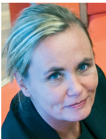
Liesbeth Homans