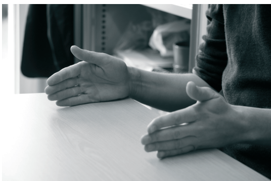
Wouter Van Dooren

Van Dooren: “De lokale besturen verschillen hard van elkaar. De dienstverlening heeft zich vaak gezet naar het geld. In steden heb je hele dure posten zoals bv. het stedelijk onderwijs, maar daarvoor krijgen ze ook meer middelen toebedeeld. In landelijke gemeenten neemt de Vlaamse Landmaatschappij (VLM) soms taken op zich die de stadsadministraties afhandelen in steden. Dat is organisch zo gegroeid. Als je alle gemeenten over dezelfde kam scheert, dan snijdt je door dat weefsel. Finaal zal dat leiden tot een aantal doorschuifoperaties naar andere beleidsniveaus.”