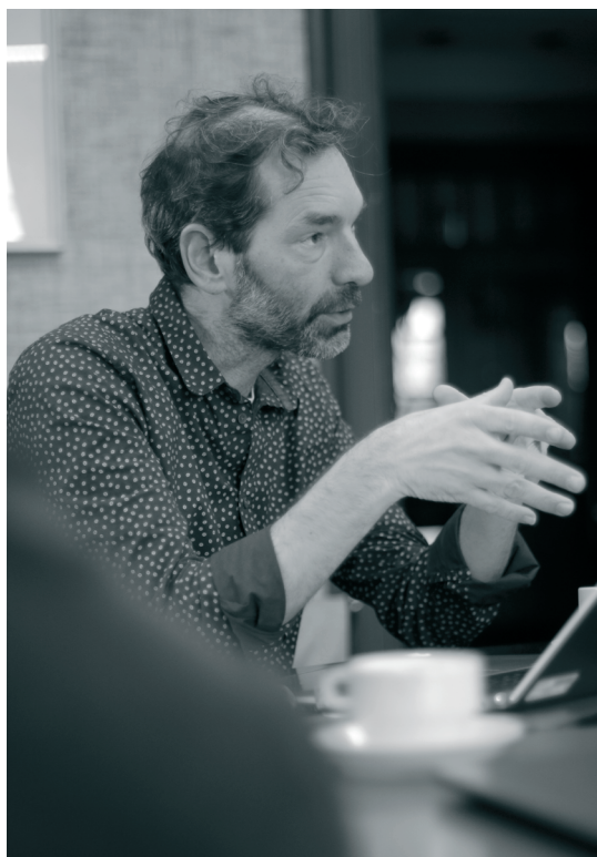
Lieven Van Eenoo

Van Eenoo: “Het treinverkeer komt voorlopig weinig uit de verf, ook al kwam het wel al aan bod. De Westhoek vraagt vooral om de bestaande twee lijnen vanuit Koksijde-Diksmuide en Poperinge-leper te behouden.”