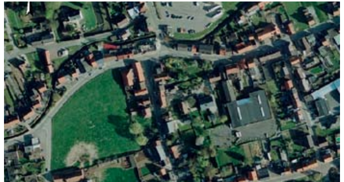
GRB en luchtfoto van hetzelfde gebied in Bertem

ceel aangeleverd door FOD Financiën staat een goed gebruik ervan in de weg.