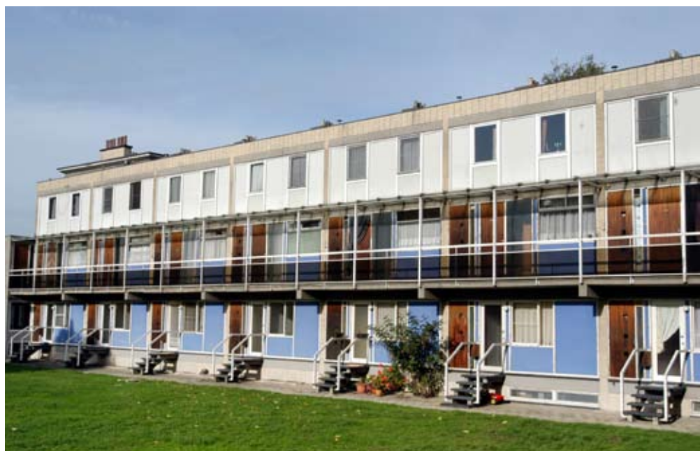
Jos Van Geellaan, Antwerpen-Zuid