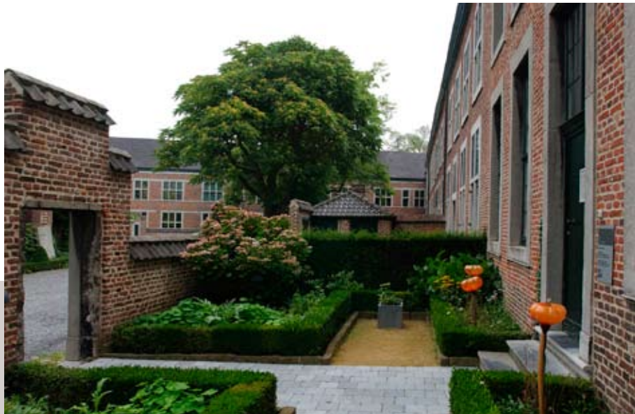
Provinciaal Begijnhof Hasselt