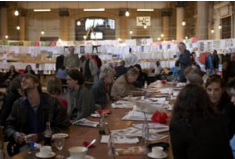
Droommarathon in het oude Justitiepaleis