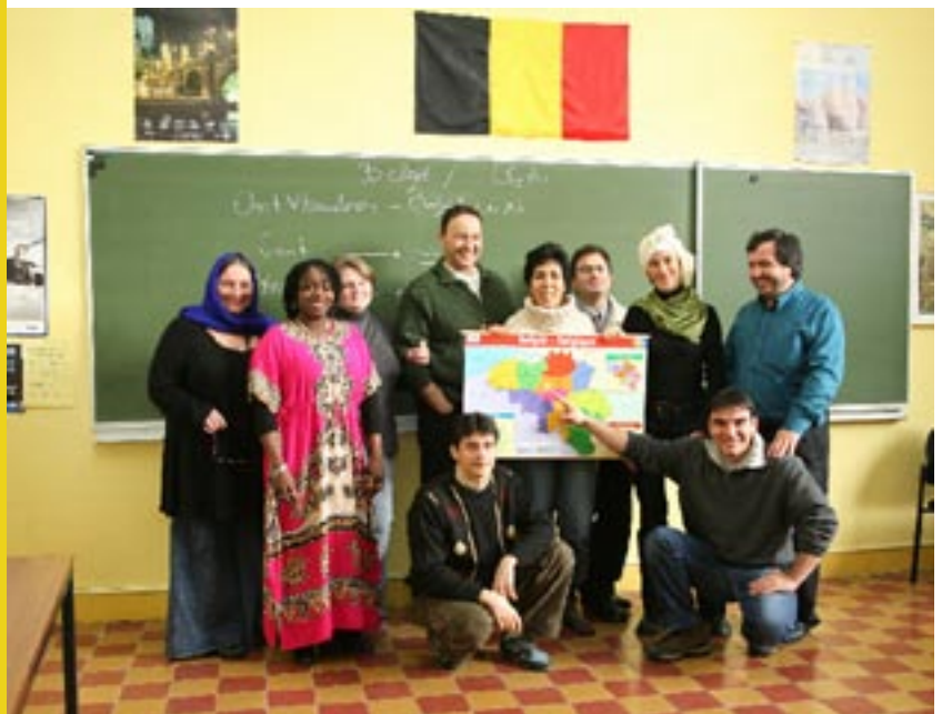
Cursus maatschappelijke oriëntatie op het onthaalbureau Kom-Pas in Gent.