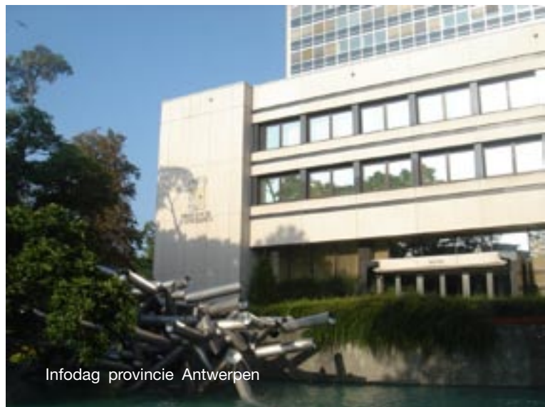
Infodag provincie Antwerpen

Indien een bestuur wenst gebruik te maken van de overgangsregeling dan moet de gemeenteraad hier geen beslissing over nemen. Dit is slechts nodig op het moment dat het bestuur één van de bepalingen, opgenomen in artikel 20 van het decreet van 21 december 2006, wenst in te voeren vóór 1 oktober 2007.