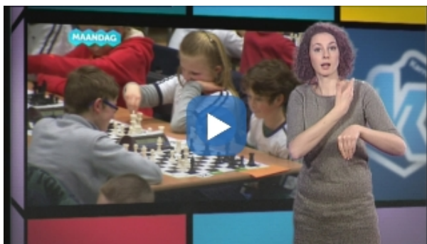
Karrewiet getolkt in VGT

Deze tweede soort media in VGT houden een radicaal andere benadering in. Er zijn tal van termen om deze media, die de meeste voorkeur geniet van de Vlaamse Dovengemeenschap, te beschrijven, zoals 'minderhedenmedia', 'interculturele media', ' minority language media ', 'Dove media', etc. Vaak wordt ook 'gemeenschapsmedia' gebruikt. In dit document gebruiken we echter 'media in VGT geproduceerd door dove Vlaamse gebarentaligen' omdat deze uitdrukking dit soort media het best omschrijft. Deze media worden immers geproduceerd door en voor dove Vlaamse gebarentaligen, een cultureel-linguïstische minderheidsgroep. Ze worden gepresenteerd in VGT en voorzien van open ondertiteling om ze toegankelijk te maken voor niet-gebarentaligen. In Vlaanderen bestaat momenteel zulke media, genaamd EyeOpener. Deze "gemeenschapsmedia" werd geproduceerd door een doofgeleid productiehuis, Visual Box vzw ( www.visualbox.biz ), en werd van 2012 tot 2014 gesubsidieerd door de vorige Vlaamse minister van Media Ingrid Lieten. Op het moment van opstellen van deze nota omvat EyeOpener vier programma's: een jeugdprogramma ' Professor Doof & (S)Tom ', een eigen journaal ' VGT-Journaal ', de talkshow ' 1001 Gebaren ' en het komisch/satirische programma ' Ongehoord! '.