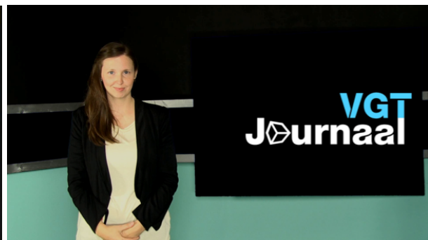
Een eigen VGT-journaal geproduceerd door dove Vlaamse gebarentaligen