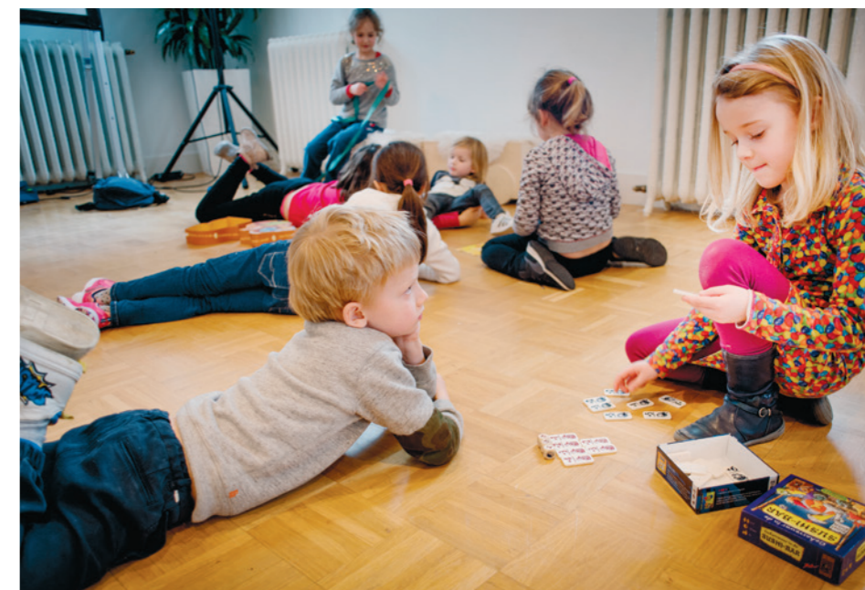
Vakantiestage Eco Airlines

Het project Kinderen in Brussel bundelt een selectie van activiteiten voor gezinnen. Op UiTinBrussel.be kunnen zij eenvoudig op zoek naar leuke activiteiten op werkdagen of in het weekend. Bovendien krijgen ze een overzicht van ateliers en workshops tijdens schoolvakanties. Kinderen in Brussel biedt ook seizoensgebonden tips, de beste musea voor kinderen, winkeltips en noem maar op. Het hele jaar door zet UiTinBrussel ook een aantal acties op rond onder meer Krokuskriebels, Anima Festival en Supervlieg. Het aanbod wordt breder bekend via de UiTinBrussel-website, -nieuwsbrief en -Facebookpagina.